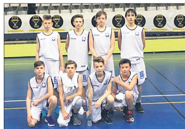
Ekipi U-12 (zgoraj) in U-14 KK Drava