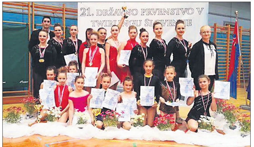
Ekipa twirling kluba Sašo Slovenska Bistrica