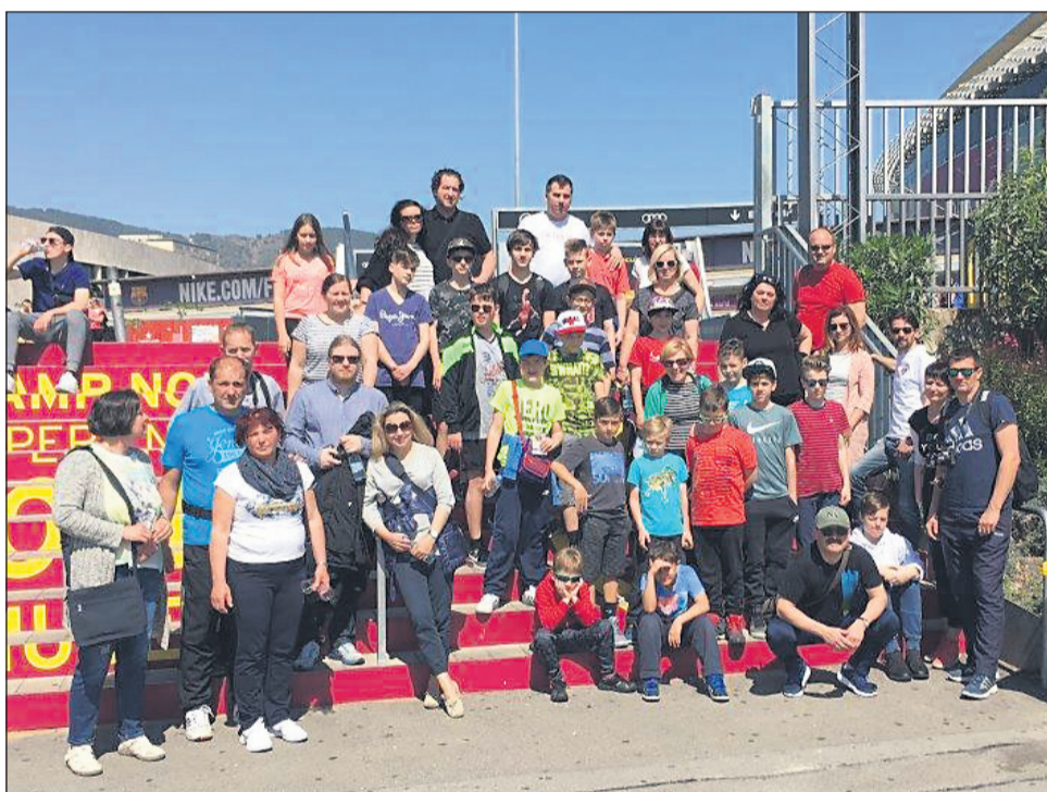
Mladi košarkarji skupaj s starši pred dvorano v Lloret De Maru