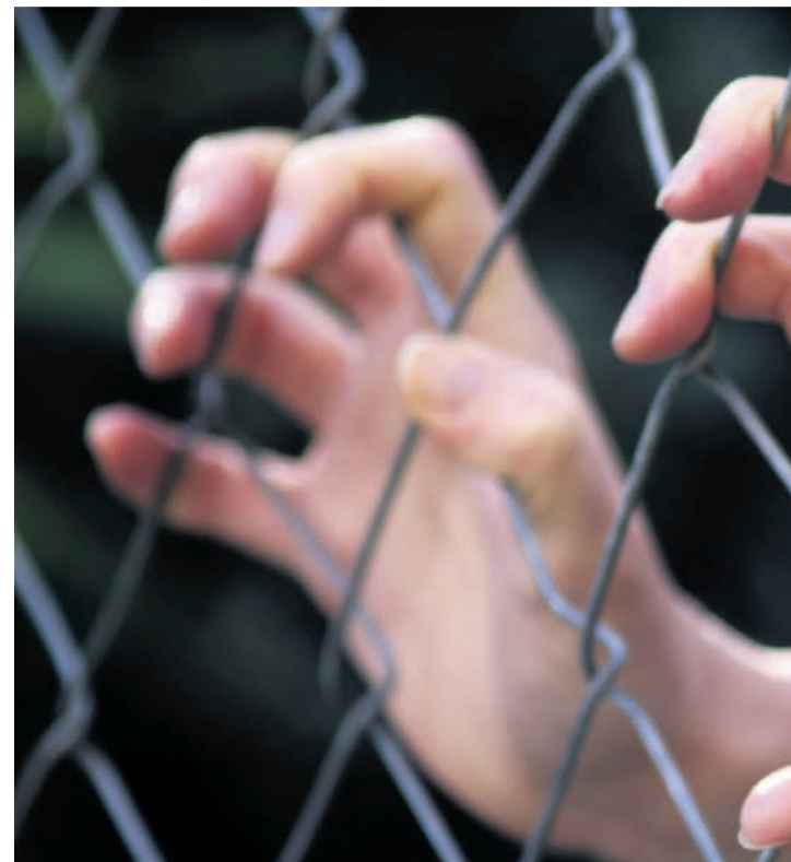
Na območju Policijske uprave Maribor so v obdobju 2006–16 obravnavali rabe podrejenega ali odvisnega položaja zaradi izkoriščanja prostitucije

»Trgovina z ljudmi predstavlja hudo obliko kaznivega dejanja. Temeljni vzroki zanjo so revščina, socialna izključenost, slabe gospodarske razmere v državah, iz katerih prihajajo žrtve, global-