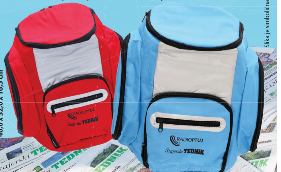
Silka je simbolična.

Hladilni nahrbtnik bo zagotovo postal vaš zvesti spremljevalec na piknikih, plaži in pohodih v naravi. Pijačo in hrano bo ohranjal hladno in svežo, prvi časopis Podravnja – Štajerski tednik – pa bo poskrbel za prvovrstne in vedno vroče vsebine. Odločite se za pravo poletno kombinacijo.