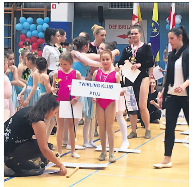
UR Ekipa twirling kluba Ptuj

Mladim športnicam gre posebna zahvala za dosežene uspehe, prav tako trenerjem in tudi staršem, ki podpirajo športnike tako finančno kot tudi motivacijsko.