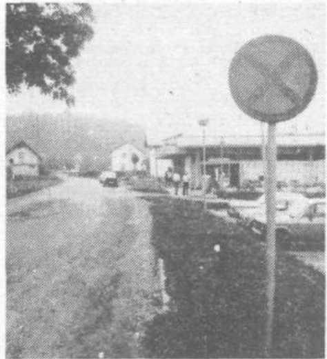
S pločnikom na desni strani ceste proti Notranjim Goricam bi močno povečali prometno varnost pešcev in otrok

Še enkrat so prisotni namenili pozornost domačim gasilcem. Ti so ob 85-letnici društva prejeli avtocestno. Vnanjčani in gostje so tudi tokrat