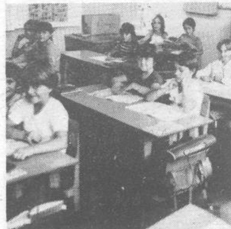
Letos ima pouk popoldne tretji razred podružnične šole v Notranjih Goricah. Če jim bo uspelo do prihodnjega šolskega leta obnoviti in povečati šolo, bo vseh 80 šolarjev hodilo k pouku dopoldne

Med zimskimi počitnicami (82/83) so hoteli zamenjati razpokani strop v telovadnici. Med delom se je sesul in dal povod za raziskavo trdnosti zgradbe. Strokovnjaki ZRMK so ugotovili, da so potrebni temeljitega zdravljenja vsi stropi v šoli. Ker bi bil tak delen poseg drag, še vedno pa ne bi