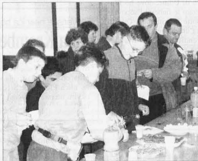
Sopra e a fianco due momenti dell'incontro tra le comunità di S. Pietro e Sambreville nell'ex "colleto"