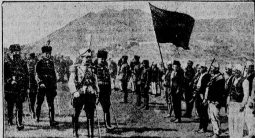
Ahmed Zogu pregleduje svoje prostovoljske milične čete.

Dva bivša uslužbenca Hapag sta v starem žolnu odpula iz Hamburga v Ameriko. Coln je brez jader, goni ga kolo z vijakom, ki se poganja z nogo. — Coln je opremljen z aluminijasto obrambo proti valovom. Sportnika upata dospeti v Ameriko v 40 dneh.