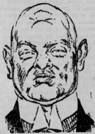
Nemški zunanji minister Stresemann.

seca maja 1926, da naj vsa še neodkrita ozemlja, ki bi jih dognal na neznanih morjih severno od Amerike, anektira za Norveško.