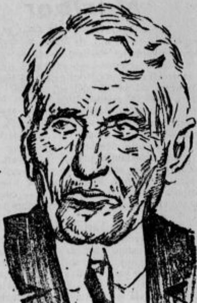
Ameriški državni tajnik Kellog.