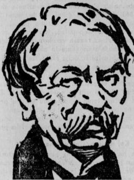
Francoski zunanji minister Briand.