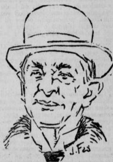
Lord Cushendun, zastopnik britanskega zun. ministra Chamberlaina.