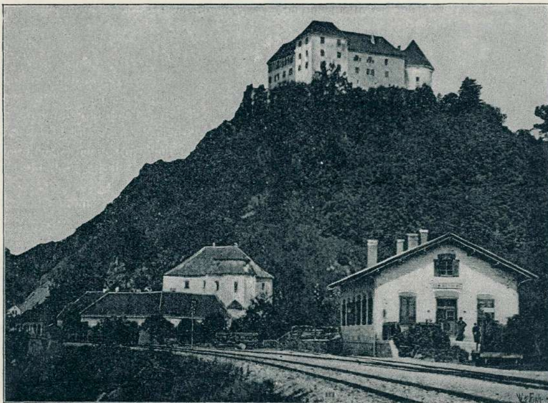
Rajhenburg na Štajerskem.