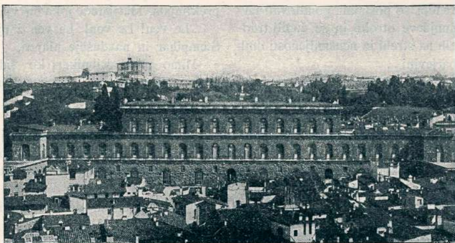
Palazzo Pitti v Florenciji.

Hu! Kako je to jezilo Štempiharja! Ali jim ni bil ukazal umakniti se v jednom tednu?