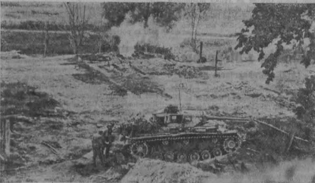
Jugozapadno od Kaluge

Hkrati s poročilom o vdoru v mesto Stalingrad, je nemško podmorniško orožje dokazalo sovražnikom, da vzlje velikim dogodkom na Vzhodu, nemška orožja enako trdo zagrabijo tudi na vseh drugih frontah vojne. Z najnovejšim uspehom potopitve 18 ladij s 121.500 brt je že itak trhli sovražnikov problem tonaže dobil nadaljnji udarec s kladivom, ki ob enem potrjuje, da da so brez podlage vse kombinacije sovražnikov, da bodo mogli izenačiti zgube z novimi gradnjami. To uvidevajo že sedaj v Londonu samem, kjer brez pridržka priznav