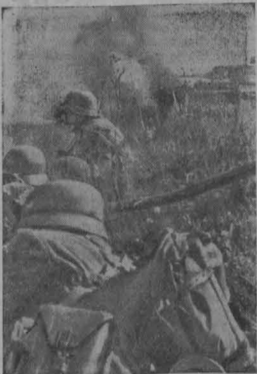
Strel je bil prekratek

Večji potrošniki naj si na vsak način že pred nastopom mraza nabaviijo in vskladiščijo čim več krompirja, ki ga preko zime potrebujejo. V ta namen naj prijaviijo predvidene potrebe na Ernährungsamt. Pri tem morajo tudi navesti točne podatke o razpoložljivem skladišču, ozir. o možnosti vskladiščenja.