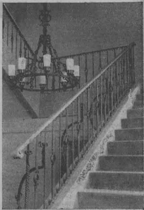
Dohod po stopnicah

Če se je že polagalo največjo važnost na domači nemški element v izgradbi in notranji opreml, se je istočasno v vsakem pogledu oziralo tudi na sodobne zahteve higijene in smotnosti. Poslopje ima moderno centralno kurjavo, vzorna protiletalska zaklonišča in kopalnice in pršne naprave, garaže itd. V neposredni bližini so sezidali stanovanjsko po-