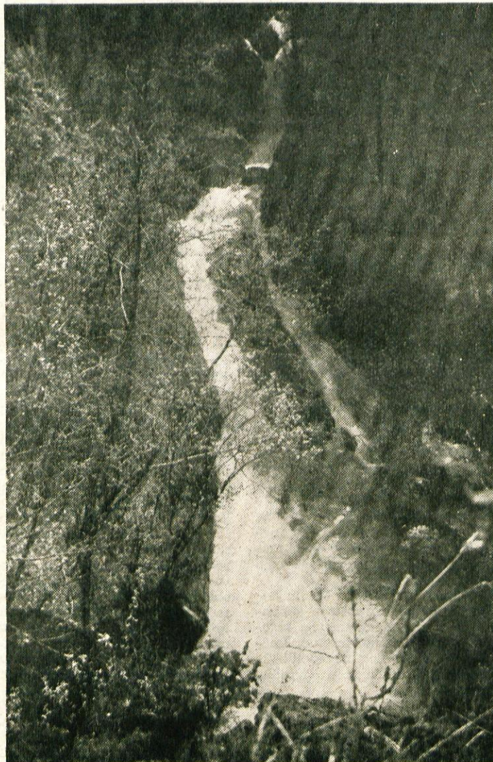
A. Ob levem bregu Lomščice navzgor

Zal niti na jezu, niti v bližini ni nobene orientacijske tablice, ki bi turista opozorila, da si v neposredni bližini lahko ogleda slap Lomščice. Slap je le pet minut nad cesto in je vsekakor vreden ogleda. Ogledati si ga moremo z levega ali z desnega brega Lomščice.