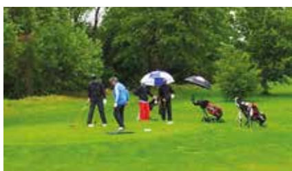
Golf, šport, ki nikakor ni za mehkužce!

Drži, kot pravijo, da pravih športnikov ne ustavi pravzaprav nič – še najmanj neugodno vreme. Golfsko igrišče Term 3000 s svojimi 18 luknjami privablja strastne golfiste ne glede na vremenske razmere. V hladnem, vetrovnem in deževnem majskem vremenu, ki nas je spremljalo pred kratkim, so se rekreativci pridno urili v udarcih golfa in aktivno preživljali svoj oddih.