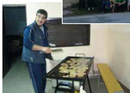
Kresovanje v Krncih