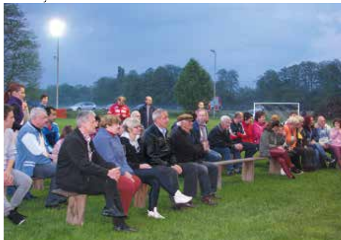
Kresovanje v Sebeborcih