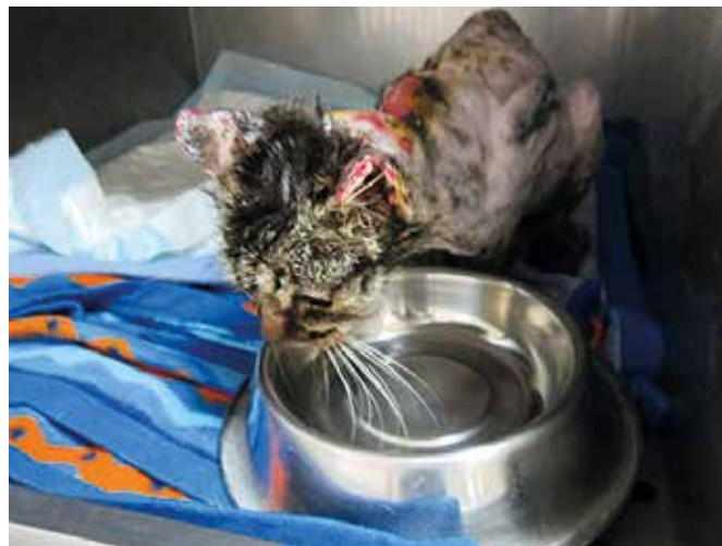
Muri na okrevanju

s predenjem ob božanju. Imeli smo občutek, da se je takoj boljše počutil kot v prejšnji koži in da se je na nek način zavedal, da smo mu pomagali, kar je nakazoval s cartanjem ter hvaležnostjo v očeh.