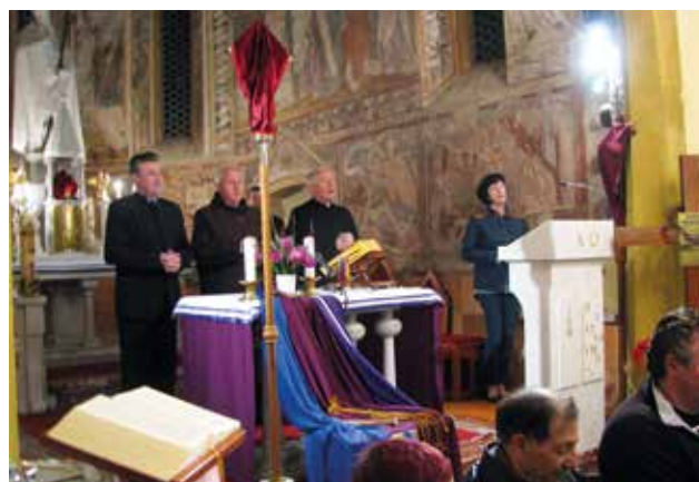
Svetopisemsko ekumensko kulturno srečanje. Martjanci, 5. 4. 2014