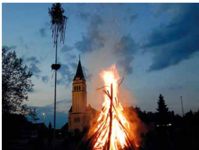
Kresovanje v Moravskih Toplicah