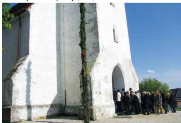
Velikonočni presnec. Martjanci, 18. 4. 2014