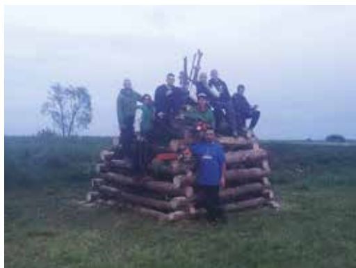
Kresovanje v Tešanovcih

Kljub slabemu vremenu se je zbralo lepo število vaščanov in drugih obiskovalcev iz sosednjih vasi in občin, ki so uživali ob pijači in jedači ter uživali v druženju. Za odlično voljo in glasbo pa je poskrbel Duo Nostalgija, s katero so obiskovalci prepevali in plesali dolgo do zgodnjih jutranjih ur. S prireditvijo so bili vsi zadovoljni, tako da se za njeno prihodnost ni treba bati.