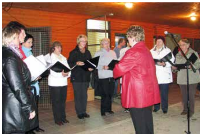
Kresovanje v Sebeborcih