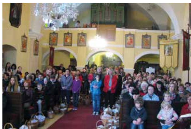
Blagoslov velikonočnih jedi. Martjanci, 19. 4. 2014