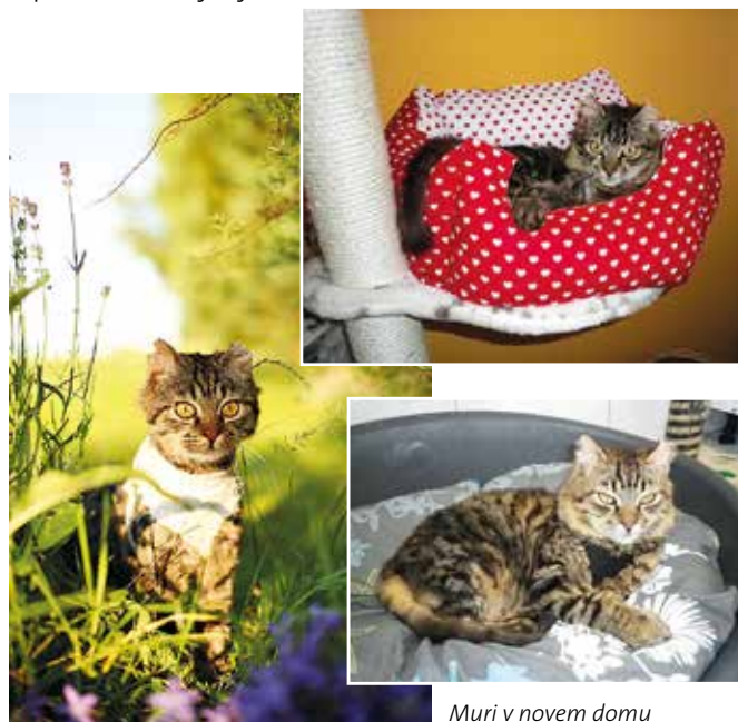
Muri v novem domu

Kmalu je odšel v nov dom, kjer je zaželen in ljubljen. Toliko hudega je preživel v svojem življenju pa je kljub temu ostal prijazen in zelo ljubeč. Srečen je, da lahko spoznava tudi lepšo stran življenja.