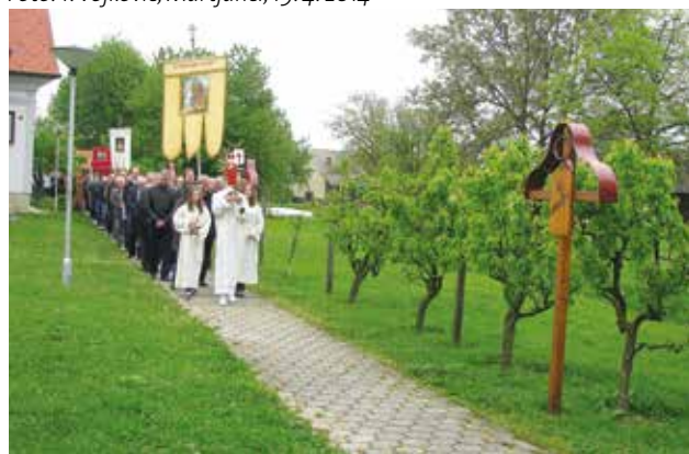
Vstajenska procesija.