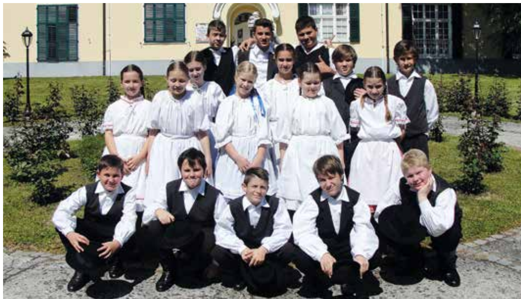
Az Ugrós Táncgyüttes tagjai Rogaška Slatinán / Člani Folklorne skupine Ugrós v Rogaški Slatini