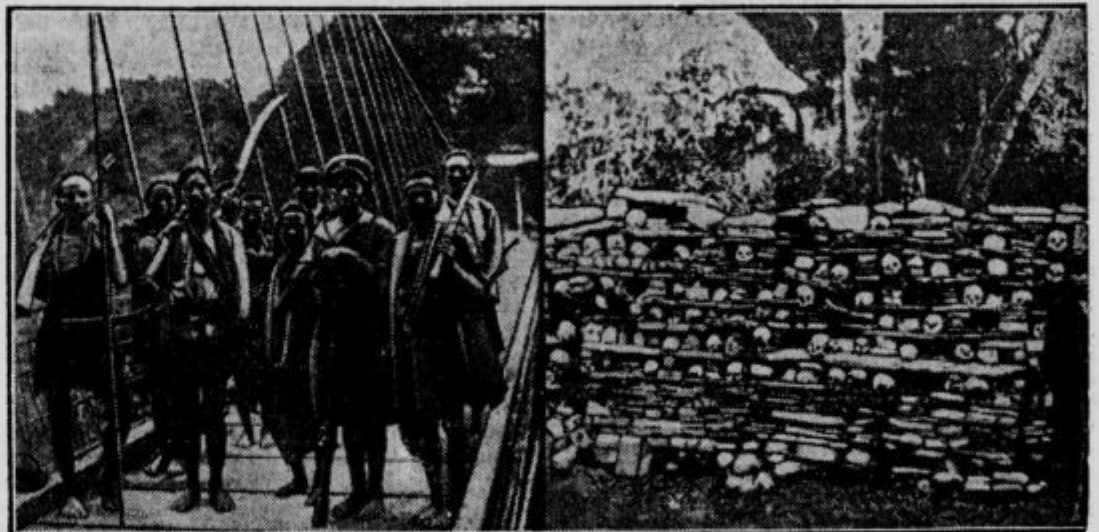
Vstaja domačinov na Formozi. Na levi lovci na človeške glave v svoji bojni opremi; desno njihov največji ponos: lobanje zmaganih žrtev. Formoza spada pod japonsko oblast; sedanja vstaja je butila čisto iznenada in bila skrajno krvava; uporniki so v mestu Nuša poklali nad 200 ljudi.

licijskega ravnatelja, in še vedno ni ta odgovorna služba končno veljavno zasedena, ker se zastopniki najuglednejših tolovajskih skupin ne morejo zediniti glede osebnosti kandidata. Chikaško občinsko politiko vodi znani župan Thompson, neizprosn republikanec, ki je pri volitvah obljuboval, da bo nadaljeval boj zoper Anglijo, »ki da bi rada zopet vrstila Zedinjene države med svoje zaslužene kolonije«. Včasih izda ta bojeviti župan svojemu (še vedno začasnemu) policijskemu ravnatelju povelje, naj »takoj Chicago reši sodrge in slednje vtakne v ječe ali pa celo pošlje na električen stol«. Tako povelje znanemu Al