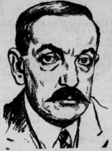
General Pangalos, ki so ga te dni aretirali, ker je pripravil vojaško zaroto.