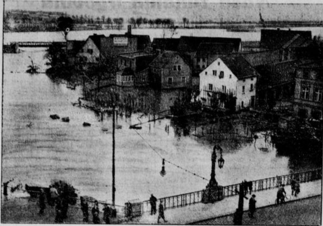
Povodenj v Slezi: mesto Liegnitz poplavljeno. Povodenj je napravila ogromno škodo, polja so opustošena, mnogo hiš se je podrlo.