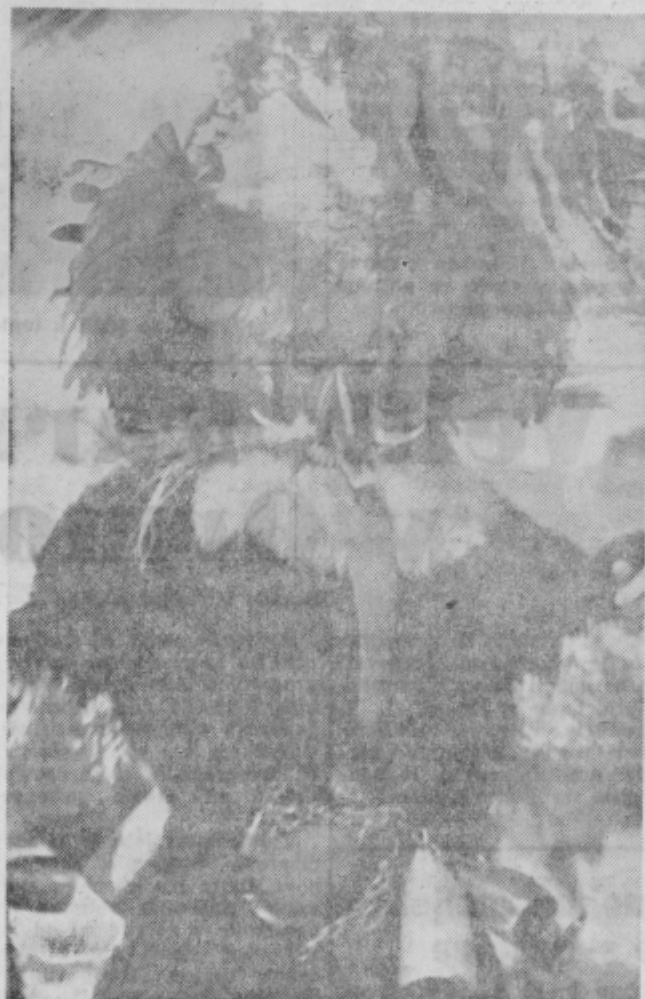
Kurent iz Rogoznice z zanimivo masko

»Zarežile je velem provi.« »Mislil, da ne upam?« »Ne delaj neumnosti! se je oglašil drugi.« »Ti si babal! Ti ne veš rabiti nož!« »Bolje ga vem kot ti, ki ga nisi ožep nimaš!« »Ne bodita neumna! Dajta mir!« se je ponovno zavzel drugi. »Pojdiva se stavit za jurja, če upaš zarezati v sedeže!« je zaklical prvi. Drugi fant, ki je razboriteža že prej miril, je tedaj ostal, segel po svojem plašču in pripomnil, da bo treba izstopiti. Res je začelo zavirati in vsi trije so bili kaj hitro pripravljani za odhod. Tisti bledični si je zapejal bundo in o pesti še vedno tiščal svoj nož. »Kdo si ne upa?« je siknilo iz njega. V trenutku je zamahnil in noževa konica je že prerezala rjavo preplekno udobnega sedeža. Vlak se je ustavljal na postaji in fantje so bili že na hodniku. V oddelku je ostal le popotni mož, ki se je peljal nekam daleč. V sedežu zranen njegga pa je zijala čisto na novo narejena zarez. Ali je bila res samo oslova dlaka?