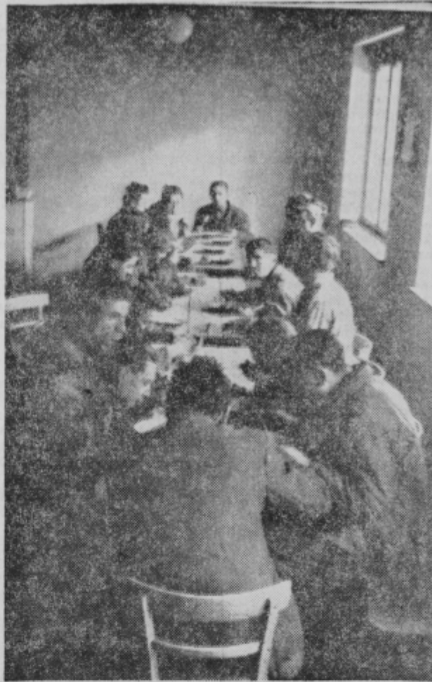
Prvič so sedli k toplemu obroku v svoji jedilnici

Izdatek 150 S din za obrok na osebo ne pomeni za zaposlene pomembnega izdatka, zlasti če je hrane toliko, da ne gre nihče lačen od mize, ker dobijo h kuhani hrani tudi primeren kos kruha.