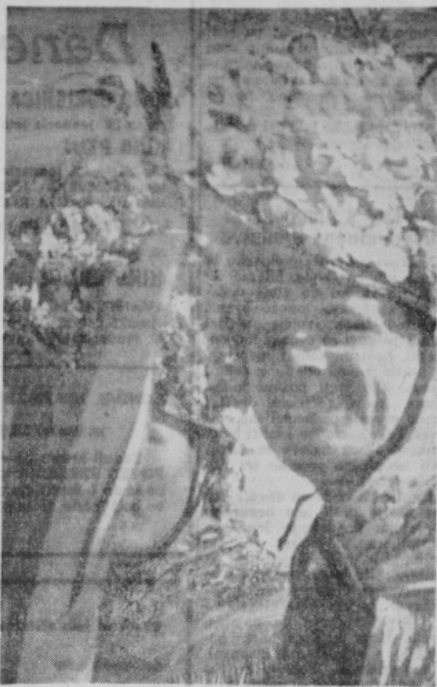
Orači iz Lancove vasi in njihovi zanimivi klobuki

Se vedno je ni bilo, vendar sem še dalje videl njen lik pred vrati in nasmeh njenega obraza. Ne motijo me gošti in točaja, ki neprestano odpirata vrata. Odišla bo, ko bo le ona sama hotela,