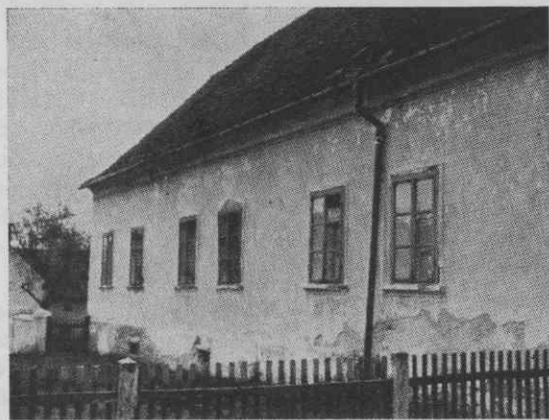
Opuščena ljudska šola v Turnišču (zahodna stran), zgrajena med leti 1830–1848