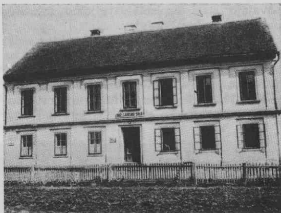
Stavba, zgrajena leta 1878, prezidana 1939 — Slovenski šolski muzej v Ljubljani