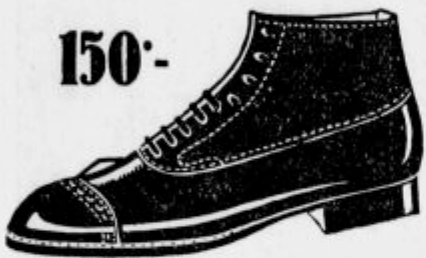
Gospodom za slabo vreme