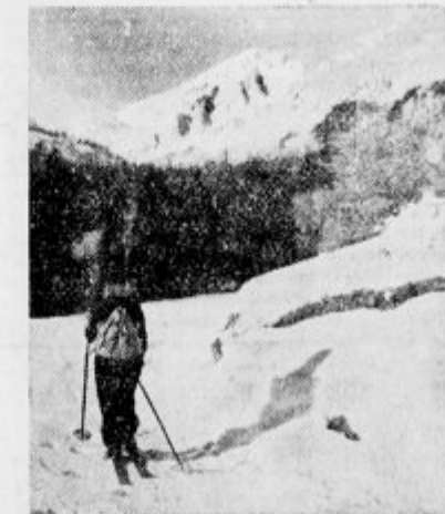
Pot na Vršič, v ozadju Mojstrovka.

Onstran mostu, kjer se cesta jame vzpenjati v brdo, že davno drvino na smučeh. Naglo minevajo ovinki, že so pod nami zasnežene snežeti v Kltru in vsa širna Krnica se odpira pogledu. Široka dolina, se višje gori izvija iz gozda in začne stromo pod navpično Kriško steno. Vzdolž Krnice strne v zvezdato nebo mogočne sence: šilasti Špink, ponižen s te strani, kakor je mogočen v Martuljaku, veličastna Škratice, ki ne trpi snega na svojih prepadnih stenah in manjši, a močni, nevarni in težavni vrhunici Ripeljani in Rusa peč.