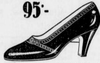
Poceni — okusno in dobro