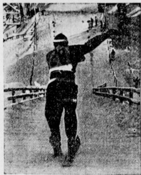
Birger Ruud na startu na veliki olimpijski skakalnici v Garmisch Partenkircheu.

Med somalijskimi vojskaki je velika nezadovoljnost, ker Abesinci v svoji plemenski mržnji neumno ž njimi ravnajo. Mnogo somalijskih plemen ni hotelo v abesinsko vojsko. Veliko tukajšnje somalijsko plemo, 2500 mož, se hoče rajši izseliti v angleško Somalijo kakor pa se bojevati za Abesince. Kakih 3500 Somalcev se je že pridružilo Ita-