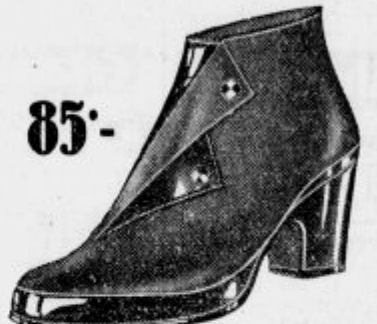
Za dež in brozgo

Vaše zadovoljstvo: praktično, najcenejše in dolgotrajno darilo!