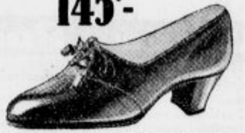
Elegantno in udobno za dame