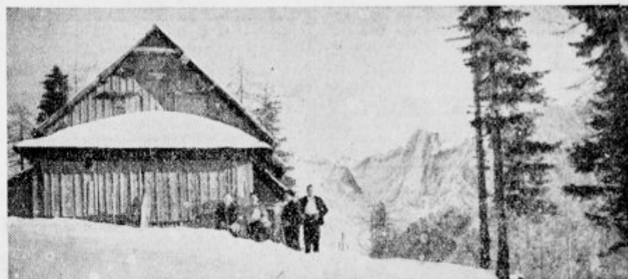
Erjavčeva koča na Vršiču.