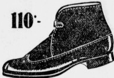
Toplota — Vaše zdravje