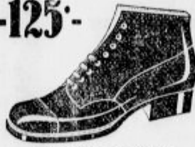
Trpežno za fante