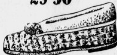
Vsakomur za oddih