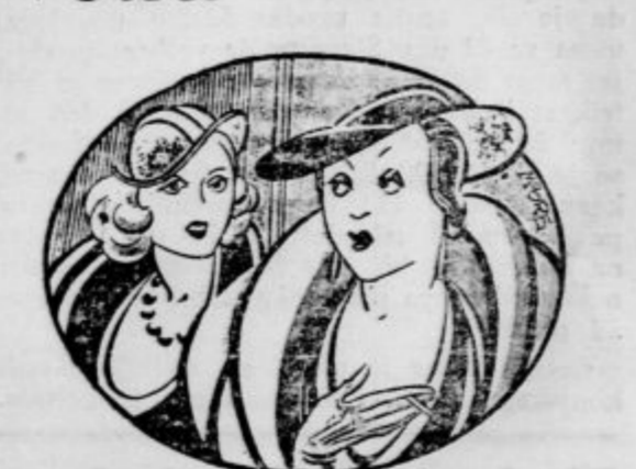
»Pravkar prihajam iz lepote salona.« »škoda, da je bil zaprt!«