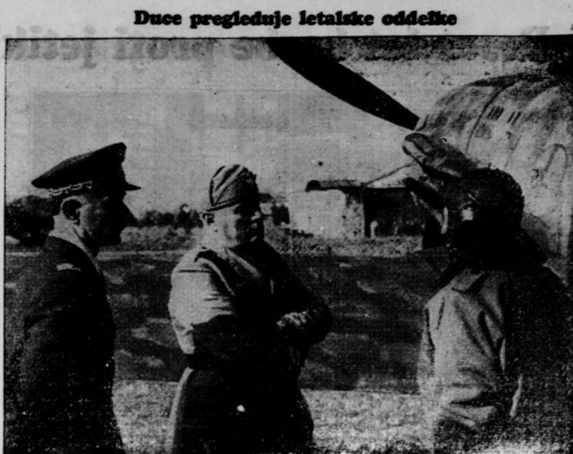
Duce pregleduje letalske oddelke

V svetovni vojni so Krim za nekoliko mesecev zasedle nemške čete, pozneje je bilo glavno oporišče protiboljševiške vojske generala Vrangla, a ko je ta doživel poraz, je postal »avtonomna sovjetska republika«.