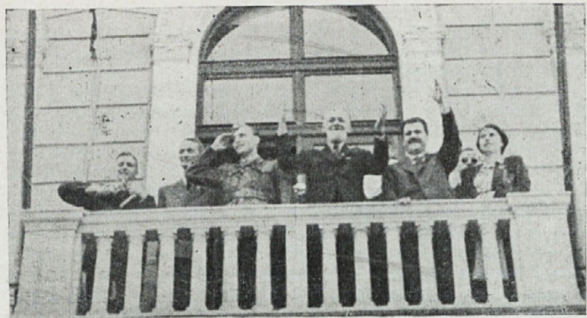
Prezident general Leon Rupnik s soprogo, šefom propagande dr. Ludovikom Pušem in drugimi sodelavci se z balkona vladne palače v Ljubljani zahvaljuje za pozdrave množic, ki so mu po mogočnem protikomunističnem taboru na Kongresnem trgu prišle izrazit zahvalo in zaupanje

nismo vedeli razrešiti. Vsak zase razčlenimo ta vprašanja in skušajmo najti napake, ki so bile za nas vse tako usodne. Nepravilno bi bilo zatrjevati, da je v našem taboru bilo vedno vse v najlepšem redu. Na drugi strani pa zopet ni prav, da bi te napake pripisovali le poedincem. Položimo si roko na srce in priznajmo, kar in kjer smo grešili. Zapustimo bodočim ročdom jasno sliko tedanjega položaja. Povejmo jim o naših uspehih in svetlih točkah naših naporov, obenem pa jim pokažimo tudi pogrške, da se bodo znali po tem ravnati in res objektivno gledati na celoten razvoj tak, kakršen je bil. Zavedajmo se, da se da tudi iz napak mnogo naučiti.