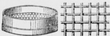
Narejena sita in rešeta z lesenim obodom v vseh velikostih.

Odrezek za črno salonsko opravo 10 gld. Blago za površnike meter od gld 3:25 više. ločen v mičnih barvah kos gld. 6- in gld. 9:95; pervien in dosking, blago za državne in železnične uradnike in za talarje sodnikov, najfinejši kangarni in cheviot, tudi uniforme za finančno stražo in orožnike itd. razpošilja po tovarniških cenah dobroznana, poštena tovarniška založna sukna Kiesel-Amhof v Brnu. Vzorci brezplačno franko. Pošiljanje natančno po vzorcu. Pozor! P. n. občinstvo se zlasti opozarja na to, da se pri naravnostnem naročevanju blago dobi dokaj ceneje, kakor pri vmesnih prodajalcih. Trdka Kiesel-Amhof v Brnu razpošilja vse blago po pravih tovarniških cenah, brez pridejanega rab. ta. 147 12-12