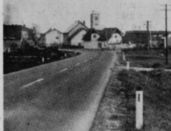
Motiv s Pragerskega

kaj bodo novega in boljšega storili za svoje okolje in predvsem tudi za svoje prihodnje generacije. Pragersko je naselje delavcev in manjšega števila kmetovalcev, ki živijo v prijetnem sožitju, pomoč pa jim ni neznana beseda. Naselje z nekaj hišami se je razvilo pred okoli 130 leti pod imenom, ki ga nosi še danes, Pragersko, kot železniško križišče. V začetku se je komaj opazno širilo, pravi razmah pa je doživelo po drugi svetovni vojni.