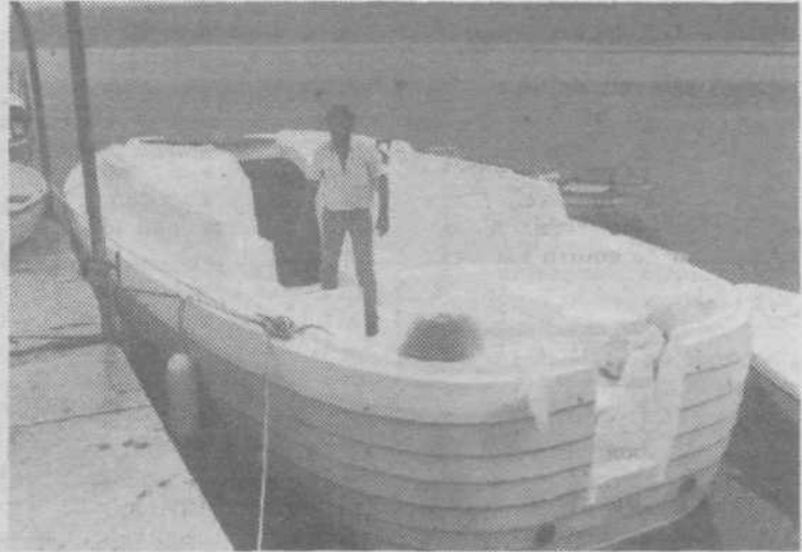
Adria 1000, največji projekt, narejen v delavnici Hočevar pri prvem preizkusu plovnosti