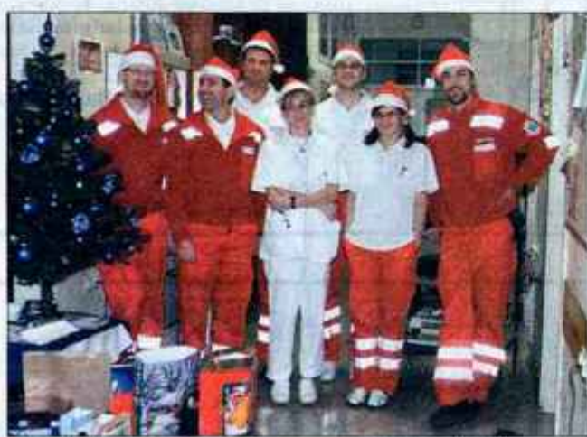
Dežurni ekipe reševalcev in zdravnikov v božičnih pokrivalih.