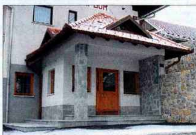
Lepo urejeno središče Šenturške Gore in novi poslovni prostori.

državnih sredstev. Naši ministri, ki so že dolgo v vladi, že znajo oceniti, kateri župan je sposoben tudi sam zbrati več sredstev, kot pa jih prosijo od države. In mene očitno ocenjujejo kot takega, ki znam dobro iskati dodatni denar. To je po eni strani za občino slabo, saj tako ne dobi toliko dodatnih sredstev, kot bi jih lahko. Po drugi strani je tudi sama slovenska ureditev taka, da se pomaga tistim, ki ne zmorejo ali pa so pomoči bolj potrebni. Pomembno je, da župan dobro sodeluje z birokracijo na ministrstvu in da zna svoje projekte dobro predstaviti."