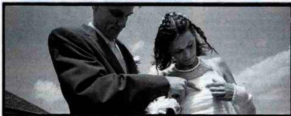
Tomaž Lunder: Pikapolonica, 2001

Fotograf Tomaž Lunder se je na Daljnem vzhodu predstavil z devetimi fotografijami večjih