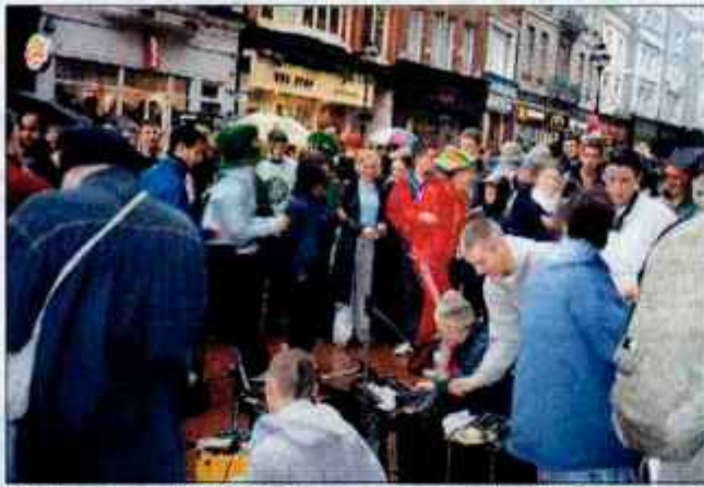
Bhakte na praznik Sv. Patricka v zanosu pojejo Hare Krišna mantrino na Grafton streetu v Dublinu, avtor članka je s klobučkom na glavi in knjigami v rokah.

Irska - Sv. Patrick je bil britanski menih, ki je v 5. stoletju z velikim uspehom širil krščanstvo po Irski, takrat še druidski - poganski Irski. Znan je zgodbe o njegovih čudežih in eden izmed njih je bil ta, da naj bi z Irskega izgnal kače. Zato na dan sv. Patricka, ki je glavni irski svetnik (Irce zato tudi kličejo Paddiyi), ljudje na vrhah za seboj vlečejo gumijaste kače v spomin na njegova silna dela. To je zelo pisan praznik. Ljudje si povežejo na glavo zelene klobuke, s štiripresnimi deteljicami na njih, nekateri si celo pobarvajo obraze v barvah irske zastave in nasploh je vzdušje zelo domoljubno.