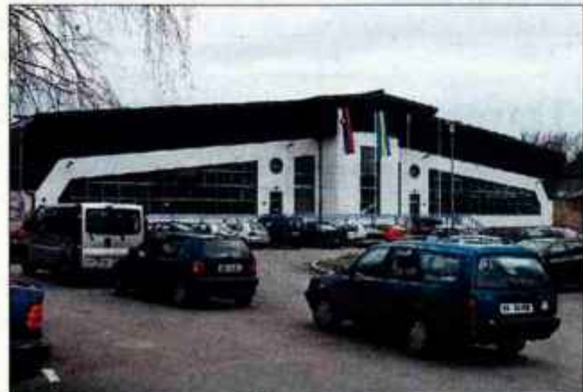
14. marca lani so v Cerkljah odprli novo športno dvorano, ki je stala 543 milijonov tolarjev.

GORENJSKI GLAS je registrirana blagovna in storitvena znamka pod št. 9771961 pri Uradu RS za intelektualno lastnino. Gorenjski glas je polletnik, izhaja ob torkih in petkih, v nakladi 22 tisoč izvodov. Redna priloga naročniških izvodov zadnji torek v mesecu je Moja Gorenjska. Ustanovitelj in izdajatelj Gorenjski glas, d.o.o., Kranj / Direktorica: Marija Volčjak / Tisk: SET, d.d., Ljubljana / Uredništvo, naročnine, oglasno trženje: Zoisova 1, Kranj, telefon: 04/201-42-00, telefaks: 04/201-42-13 / E-mail: info@g-glas.si / Mail oglašil: telefon: 04/201-42-47 sprejemamo nepriknjeto 24 ur dnevno na avtomatskem odzivniku; uradne ure: vsak dan od 7. do 15.00 ure. Naročnina: telefon: 04/201-42-41 za prvo trimesečje 2004 znaša 6.200 tolarjev, posamezniki redni plačniki imajo 20-odstotni popust in zanj trimesečna naročnina znaša 4.960 tolarjev. Letna naročnina znaša 26.000 tolarjev, posamezniki - redni plačniki imajo 25-odstotni popust in zanj letna naročnina znaša 19.500 tolarjev. V ceni je vračunan DDV. Naročnina se upošteva od tekoče številke časopisa do PISNEGA preklica; odpovedi veljajo od začetka naslednjega obračunskega obdobja. Za tujino: letna naročnina 100 evrov; Oglasne storitve: po ceni; DDV po stopnji 8.5 % v ceni časopisa / CENA IZVODA: torek 200 SIT, petek 300 SIT.