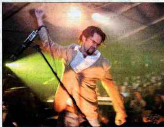
Petar Grašo poln energije.