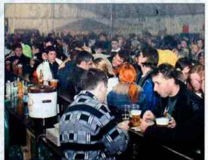
Pod šotorom na Primskovem je bila gneča.