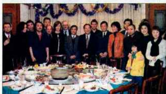
Kitajsko-slovensko druženje v Šanghaju, foto: Nives Lunder.

stovanje slovenskih umetnikov na Kitajskem je podprla tako država kot nekatera naša podjetja, ki poslujejo s Kitajsko, ob razstavi pa je izšel tudi obsežen dvojezični kitajsko-angleški katalog z barvnimi reprodukcijami razstavljenih del, predstavivami sodelujočih umetnikov in tekstoma obeh avtorjev razstave. Razstava Različnost enakega z nekaterimi spremembami (več slovenskih umetnikov in manj kitajskih) se letos poleti seli na Ljubljanski grad. Igor Kavčič