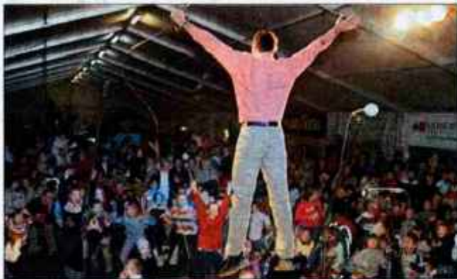
Čuki so leteli skupaj s svojim občinstvom.

Kaj nam bo prineslo? Kaj nam bo vzelo? Se ga bomo čez leto dni z veseljem spominjali? Danes si lahko ogledate foto utrinke z novoletnega rajanja v Kranju. Namenjamo vam tudi zgodbo o sreči, s katero boste, upamo, vsak dan v letu začeli z nasmehom.