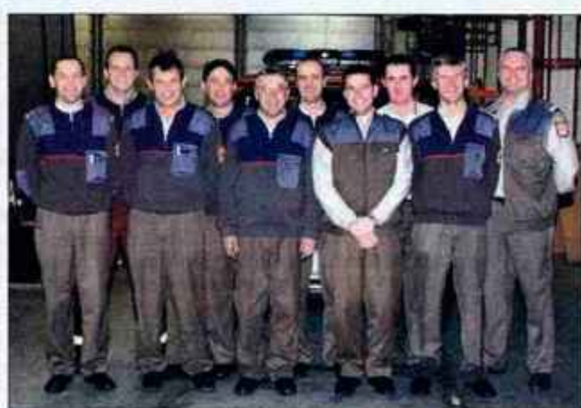
Gasilska v zgodnjih urah prvega januarja.

Podobno je bilo pri gasilcih . Pred polnočjo so posredovali na Kokrici, ko je zagorel kontejner