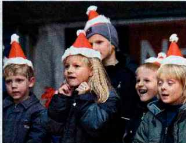
Pravičnica vas - najmlajši so v delavnicah naredili tudi božične kape.

Medtem ko je sledila sestri v dvigalo, ji je ta na kratko opisala sobo, v kateri bo stanovala.