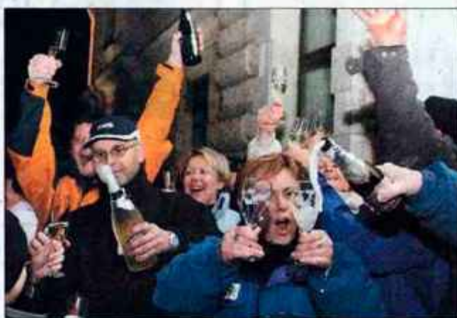
Na zdravje za leto 2004.