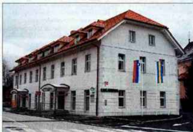
V upravno poslovni stavbi so nastarjeni občina, krajevni urad, zdravstvena ambulanta, lekarna in pošta.

začeli, v investicijo sodi tudi izgradnja kulturne dvorane s 400 sedeži, zobne in splošne otroške ambulante. Investicijo, ki je vredna okoli 700 milijonov tolarjev, bomo težko v celoti zaključili že to leto, zagotovo pa leta 2005. Tu mislim predvsem na kulturno dvorano, katere oprema bo stala okoli 50 milijonov tolarjev. Celoten šolski,