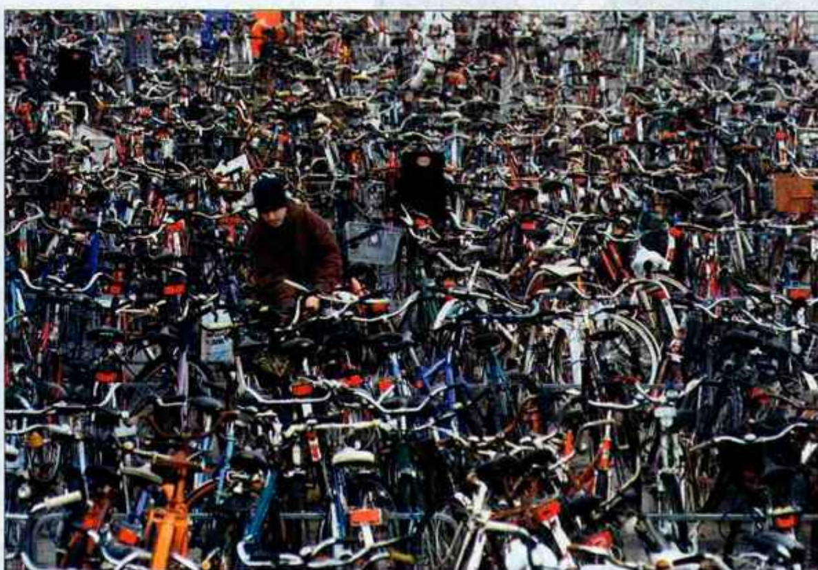
Grega na "parkiršču" tipičnega prevoznega sredstva.

Sicer pa je Švedska pozimi pravi kraj za dolga večerna druženja, temni se namreč začenja že ob treh popoldan. In če se večer zavleče v noč, zjutraj ni nobene slabe vesti glede poznega vstajanja - dani se šele ob devetih. Pa tudi tistih 6 uric med deveto in tretjo ni bleščeče svetlih. Če dan ni popolnoma sončen (in pozimi je malo takih, ki so), imaš ves čas občutek, kot da se je ravno začelo mračiti. Najbrž zaradi tega Švedsi na oknih navadno nimajo rolet, še zavese so zelo redke. Tako se ob večerih zdi, kot da skozi velika okna njihovih hiš opazuješ reality-show njihovega vsakdanjika. Poleg ogromnih oken lovijo dragoceno svetlobo še na vse druge možne načine - na podežlju si ob hiši naredijo nekakšen steklen prizidek, ki je nekaj med dnevno sobo in jedilnico, da lahko užijejo vsak (morebiten) žarek. Ob našem mrščenju nad dežjem, hladom in mrakom Grega razlaga o poletjih na Švedskem, ki da so sončna, topla in svetla. Takrat se celo severnjaki kopajo v morju in se gredo piknike na plaži. Pravljico!