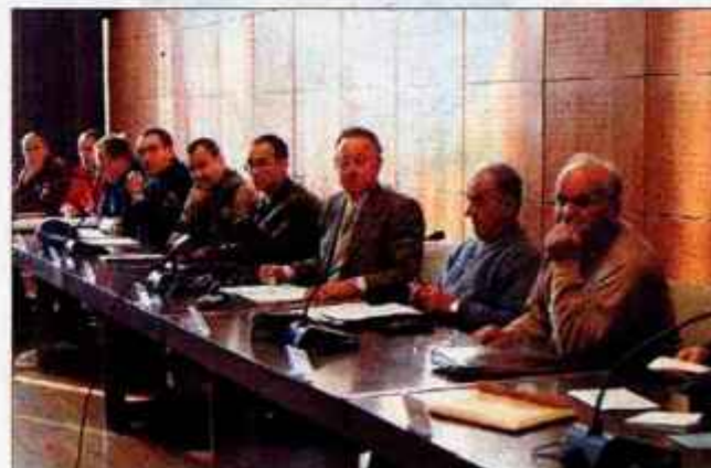
Prireditve v Dražgošah so včeraj predstavili na konferenci za novinarje.

V četrtek, 8. januarja, bo v Zalem Logu tradicionalno srečanje borcev Cankarjevega bataljona in udeležencev Poljanske vstaje in vodstvom glavnega odbora Zveze združenj borcev Slovenije. V soboto, 10. januarja, zvečer pa se bosta začela dva najzahtev-