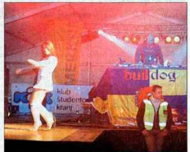
Hiša - večer za ljubitelje modernih ritmov.

Povedala ji je, da jo čaka majhen prostor z belimi zavesami na oknih. "Odlično! Všeč mi je!" je z navdušenjem vzkliknila kot osemletni otrok, ki je v dar dobil majhnega kučka.