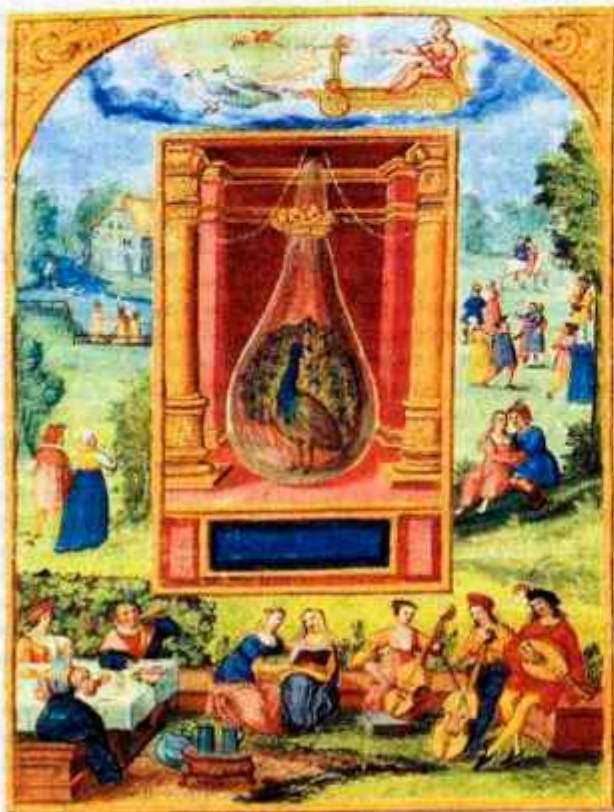
Prispodobna Venere in njenega vpliva na ljudi iz nemškega alkimističnega rokopisa, 16. stoletje.

in ženstvenega značaja. Včasih je bila Venera zvezda nežne zapeljivosti in prva med nebeškimi lepoticami, ki je imela mili vpliv na zaljubljen kontemplativne duše, astrologi pa jo povezujejo z občutki pohotne privlačnosti in ljubezni v povsem organskem smislu. Kakorkoli, leto ki je pred nami, naj bi bilo pod njenim okriljem bolj prijetno kot prejšnje, saj se pod njenim okriljem v človeku krepi veselje do življenja kot najbolj prefinjenega in poduhovljenega uživanja estetike, ter nežnost, ljubkovanje, srečno občudovanje, milina, dobrota in uživanje v lepoti. Njen svet označujejo za kraljestvo srčnega miru, ki se mu pravi sreča. Katja Dolenc