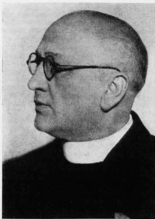
DR. ANTON KOROŠEC voditelj slovenskega naroda