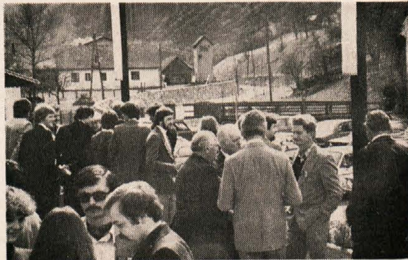
Tudi med opoldanskim admorem so se nadaljevalo živahne diskusije

ZSO. „Početlje koroškega Heimaldienta ob zadnjih znakih širjenja gospodarskega sodelovanja med Koroško in Slovenijo oz. Avstrijo in Jugoslavijo je dokaz za to, kako zelo se koroške konservativne sile zavedajo, da vodi ta zgodovinski proces tudi do enakopravnosti Slovencev v Avstriji, in to v trenutku, ko si nemškonalistične sile z vsemi sredstvi prizadevajo, da bi Slovenci še nadalje ostali podrejeni in v getu. Prav zato mislim, da nam mora biti vsak hip jasno, kakšen je zgodovinski trenutek, v katerem živimo, kakšen je naš cilj, po kakšni poti bomo prišli do njega in kdo bodo naši zavezniki na tej poti. Za doseg tega pa bo seveda potrebno ne samo izdelati jasen program, temveč bomo morali biti navzoči s stalno družbenopolitično akcijo na vseh področjih in v najširših krogih južnokoroškega prebivalstva — biti bomo morali skrajno aktivni, vedno prisotni in tudi dosledno samokritični.“