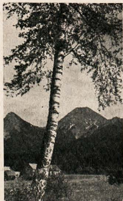
Prijetne velikonočne praznike želita vsem bralcem, sodelavcem in prijateljem UREDNIŠTVO IN UPRAVA Slovenskega vestnika

Trenutno so pogajanja med vodstvom rožeškega živalskega parka in sokolarjem inž. Kollingerjem, da bo kot prejšnja leta, tudi letos predstavil svojo družino ptic ujed.