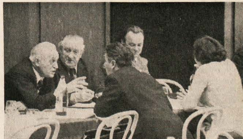
Prizor z občnega zbora: Razprava v malih skupinah.

Svoje kratko poročilo je tajnik SPZ zaključil z zagotovitvijo, da je Slovenska prosvetna zveza za sodelovanje z vsako drugo kulturno organizacijo, ki je proti zatiranju slovenske narodne skupnosti na Koroškem in ki ne spodbopava naših idejnih pogledov, slonečih na izročilih narodnoosvobodilne borbe.