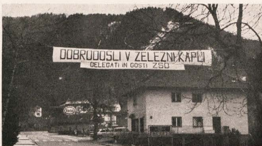
Z velikim transparentom je Železna Kapla pozdravila delegate in goste občnega zbora ZSO.

Ostane še beseda k našemu kulturnemu prizadevanju in splošnemu osveščanju našega človeka. Zdi se mi, da ni preveč rečeno, če trdim, da na kulturno-prosvetnem področju, kar se