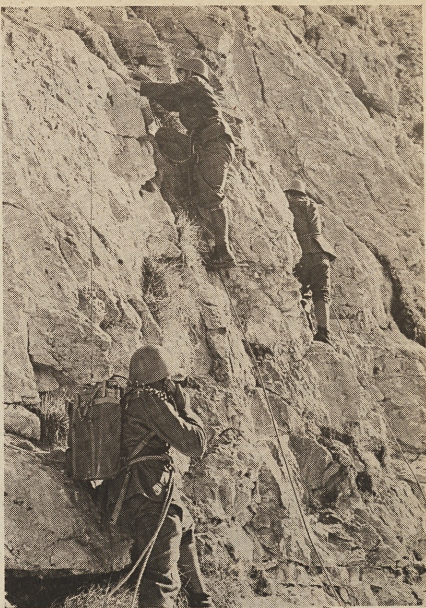
Pripadniki planinske enote JLA so se zagrizli v strmo steno.

VSEM PRIPADNIKOM NAŠE LJUDSKE ARMADJE OB PRAZNIKU — 22. DECEMBRU NAŠE ISKRENE ČESTITKE!