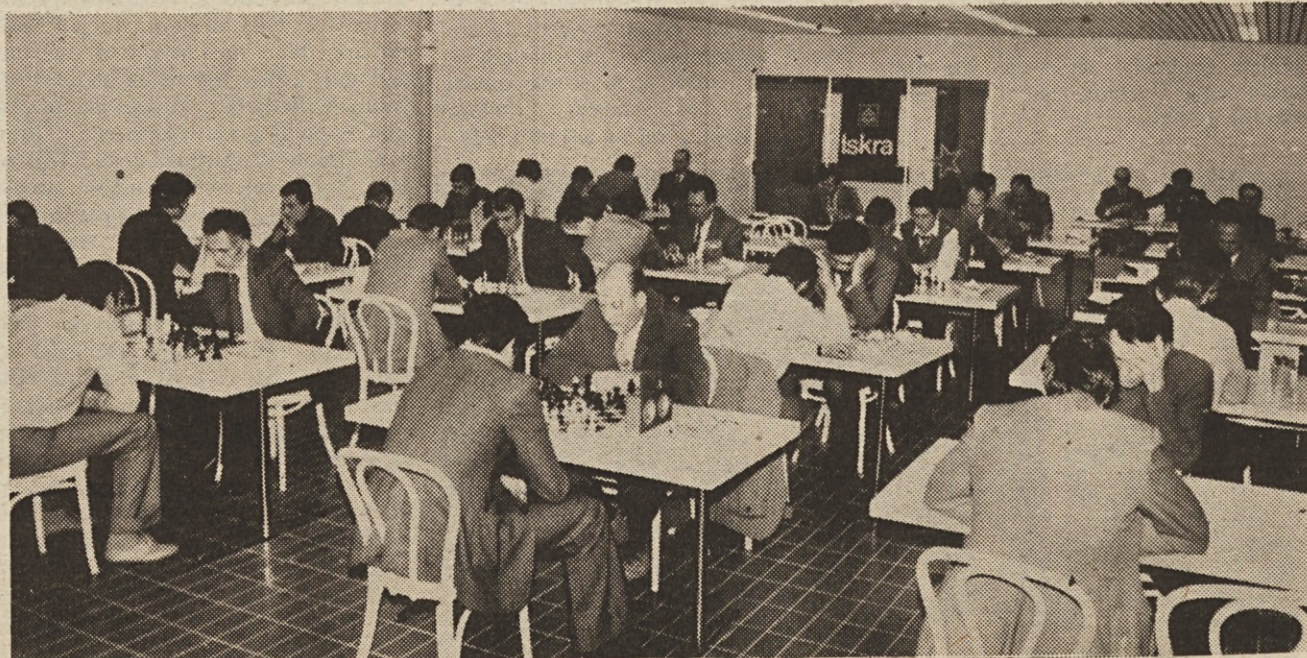
V počastitev dneva naše armade je bil v nedeljo, 14. decembra, v prostorih naše menze v stolpnici na Trgu revolucije že drugi šahovski dvoboj na 52 deskah med šahisti ljubljanske garnizije in šahisti Iskre. Gostje so se to pot bolje odrezali in dvoboj zaključili v svojo korist. Podrobnosti o šahovskem dvoboju preberite na 8. strani.