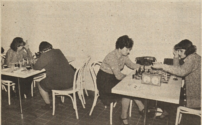
Med udeleženci letošnjega šahovskega dvoboja Iskra : JLA sta na obeh straneh sodelovali po dve šahistki.