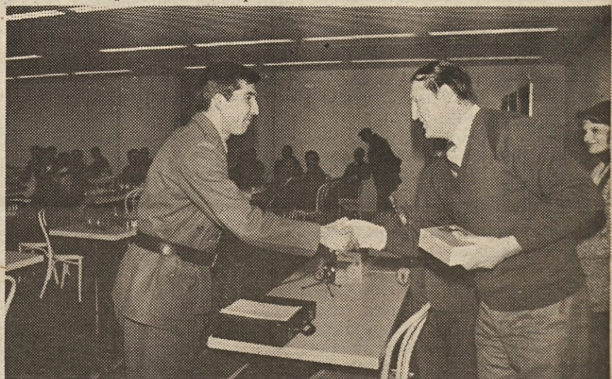
Pet brivnikov za darilo pripadnikom šahovske ekipe JLA je žreb namenil štirim vojakom in vojaškemu zobozdravniku.