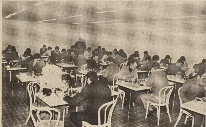
Po uvodnem ceremonijalu so se šahisti obeh ekip brž zagrizli v neizprosno boj.