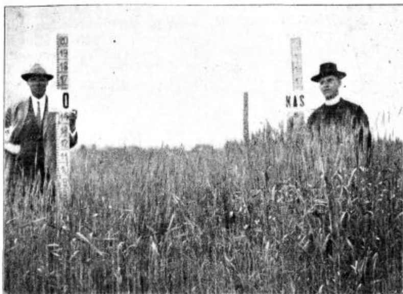
Pod. 42. Gnojilni poizkus pri pšenici na škofovih zavodih v Št. Vidu pri Ljubljani.