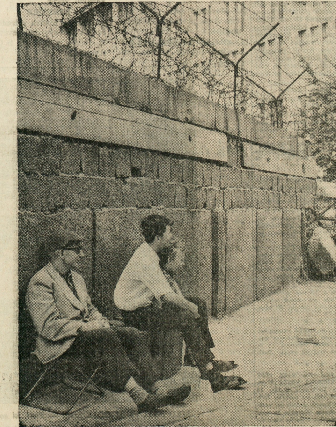
VSAKA REČ IMA SVOJO DOBRO STRAN — Slika kaže del zloglasnega "Zidu", ki loči svobodni Zahodni Berlin in rdečega Vzhodnega. Trojica na sliki se je spravila ob zid, kjer je našla senco v poletni vročini.