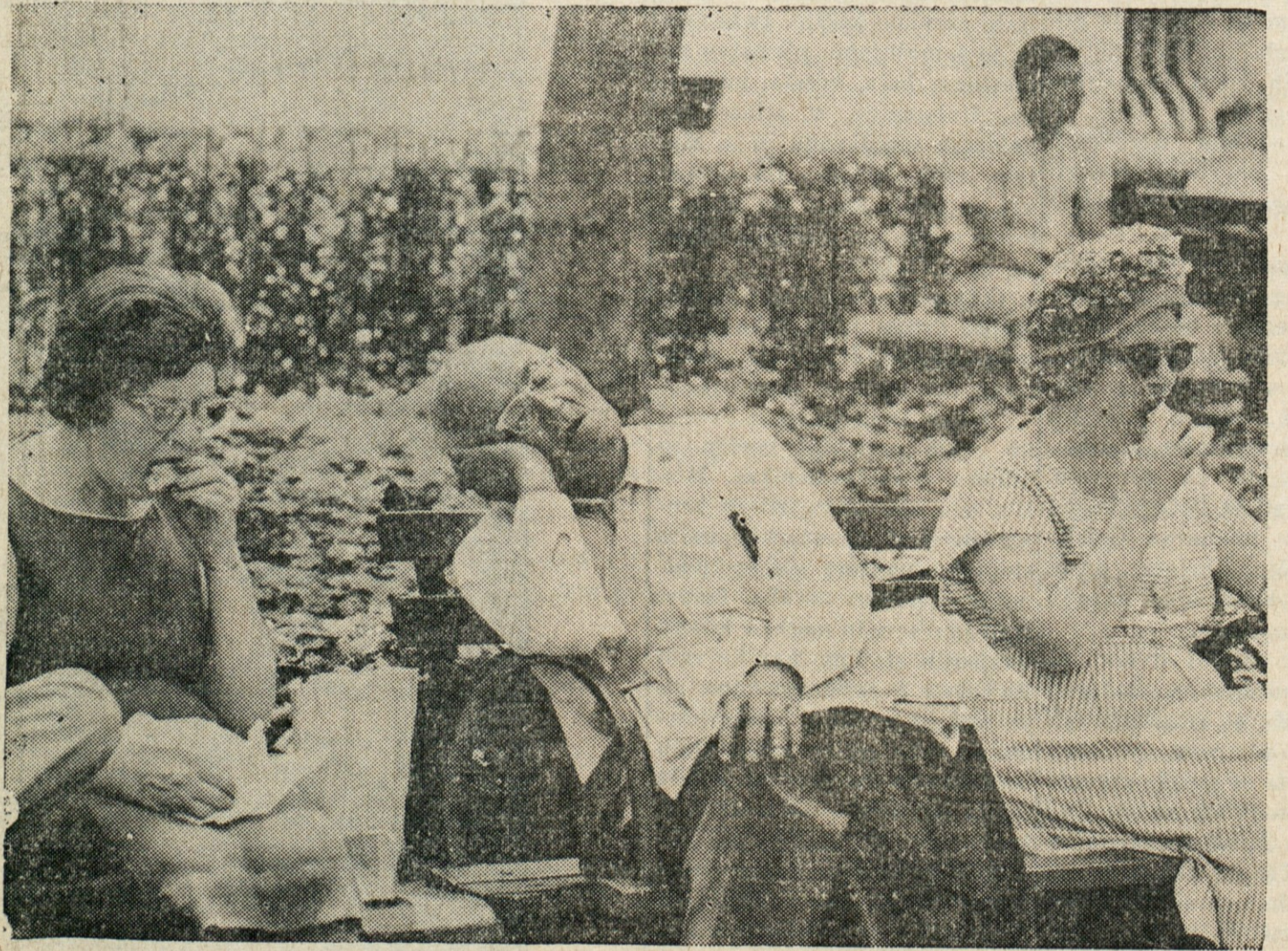
MED DELOVNIM ODMOROM — Tisti, ki so zaposleni v bližini, hodijo ob lepem vremenu med opoldanskim delovnim predelkom v Bryant Park v New York Cityju, kjer je ob tem času redno radijska oddaja koncerta. Na sliki vidimo dve uslužbenki, ki uživata ob glasbi svojo malico, njun tovariš pa je enostavno začel vleči dreto.

expandable, Oil heat, Forced air. Lot 30x125, large living room and dining room. W/W crptg. Very low taxes. 1 Blk. to schools, churches, transportation. $19,500. PH. 763-1527. (160)