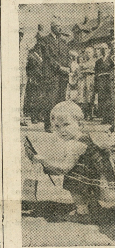
VELIKI CHARLES JO NE ZANIMA — Punčka v ospredju je slučajno prišla na fotografijo, ko je fotograf hotel posneti predsednika De Gaulle (v ozadju) tekom njegove nedavne poti po Franciji.

— V Združenih državah se smrtno ponesreči na svojih domovih letno okoli 27.000 oseb.