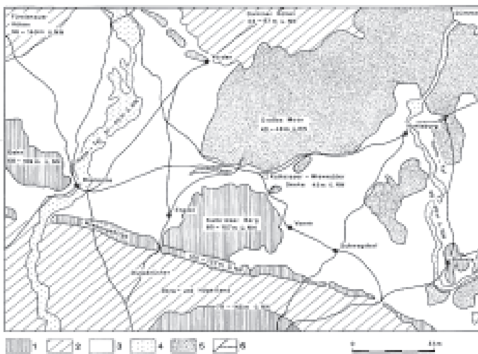
Ilustracija 2: Pokrajinski prikaz: področja raziskave.