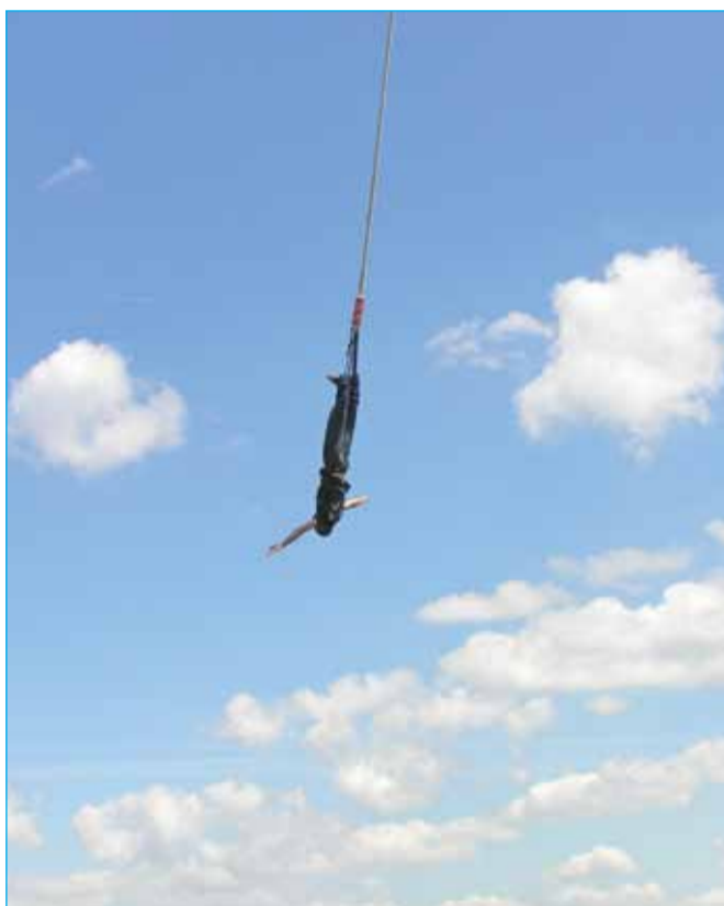
Tretje nagrajena fotografija avtorja Antona Majeriča: Skok v poletje.