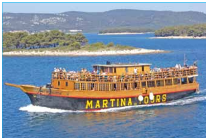
Lara Roškar: Morski pozdrav