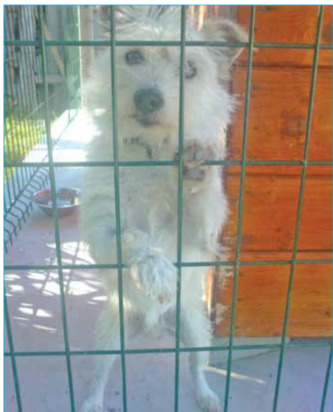
Alojz Šmid: Radovedni Taček