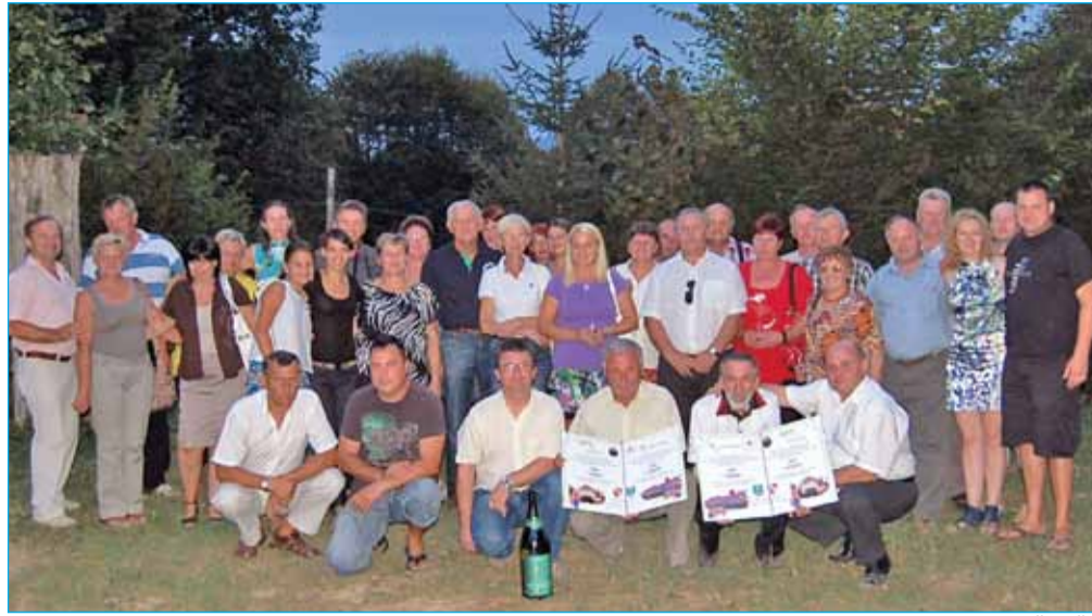
Zbrani ob podpisu listine o prijateljstvu

Minilo je že osem let, odkar smo se spoz-