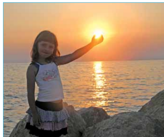
Drugo nagrajena fotografija avtorice Alenke Rižnar: As, kako je vroče ...