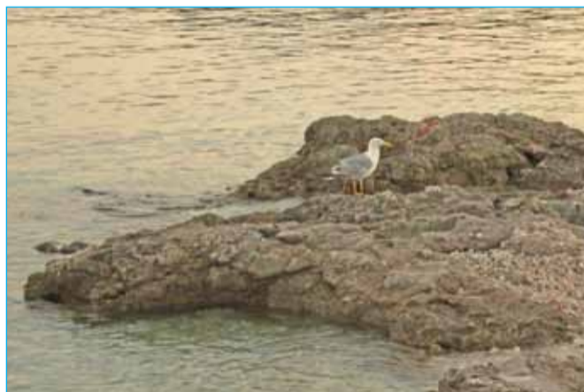
Teja Črnivec: Fotografija z letošnjega dopusta v Puli