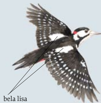
veliki detel ( Dendrocopos major )