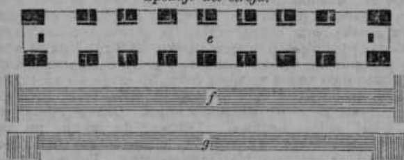
Spodnji del stroja.