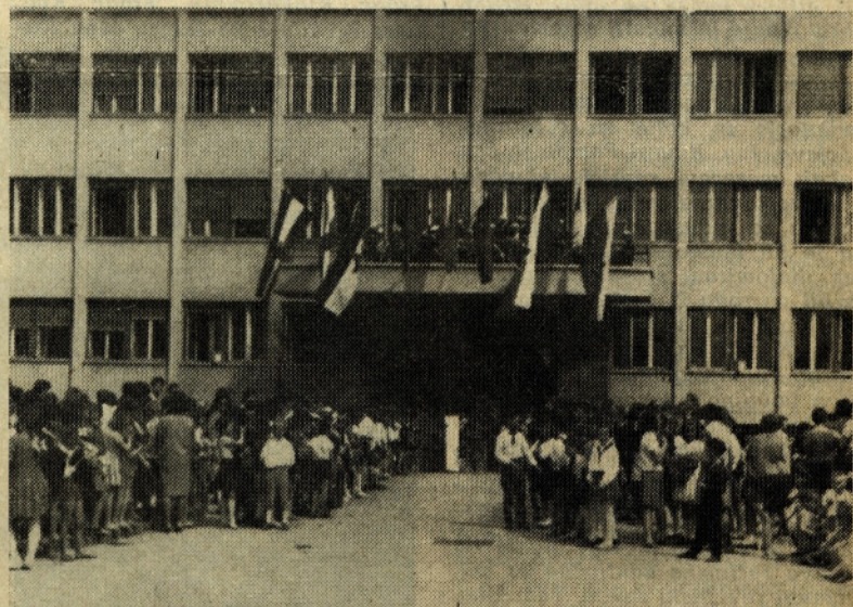
Člani kolektiva, mladinci in pionirji čakajo štafeto

Da bodo tečaji, ki jih organizira naš izobraževalni center za člane kolektiva, čim kvalitetnejši, je UO na zadnji seji sklenil, da se predavateljem honorira izdelava skript po 400 din za stran A4, izobraževalni center pa se zadolži, da skrbi za to, da skripta ne bodo preobsežna in da bodo pisana razumljivo.