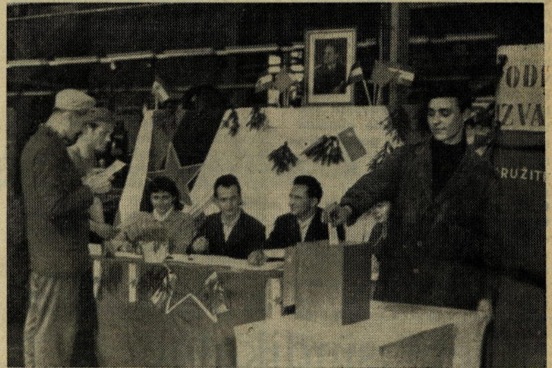
Na enem izmed prejšnjih volišč

Z vidika demokratičnosti volitev je predviden tudi drugi način postavljanja kandidatnih list. Določeno število članov kolektiva, tj. neke volilne enote, lahko sestavi svojo kandidatno listo, ki jo mora podpisati najmanj 10 % članov dotične volilne enote. Na tej kandidatni listi je lahko tolikšno število članov, kolikor se jih izvoli, lahko več, lahko pa tudi manj. Pri glasovanju so v primeru več kandidatnih list izvoljeni tisti kandidati s