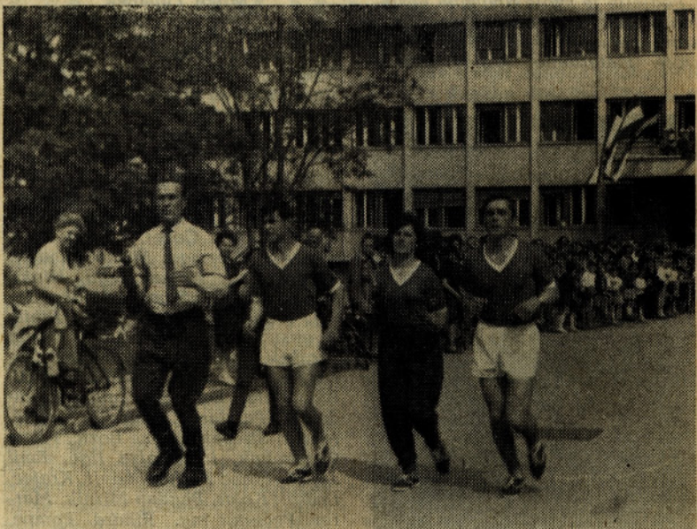
Odhod štafete izpred tovarne

Učenci sprejemajo nagrado po Pravilniku o delitvi osebnih dohodkov podjetja, oziroma po določenih kriterijih šole »ŠIKC« Štore. Rok prijave do 31. 7. 1964 na kadrovsko-socialni sektor podjetja. Učenci bodo v prvem letu obiskovali šolo strnjeno v Štarih, v 2. in 3. letu pa vrši prakso v podjetju in hkrati obiskuje 2. in 3. letnik šole.