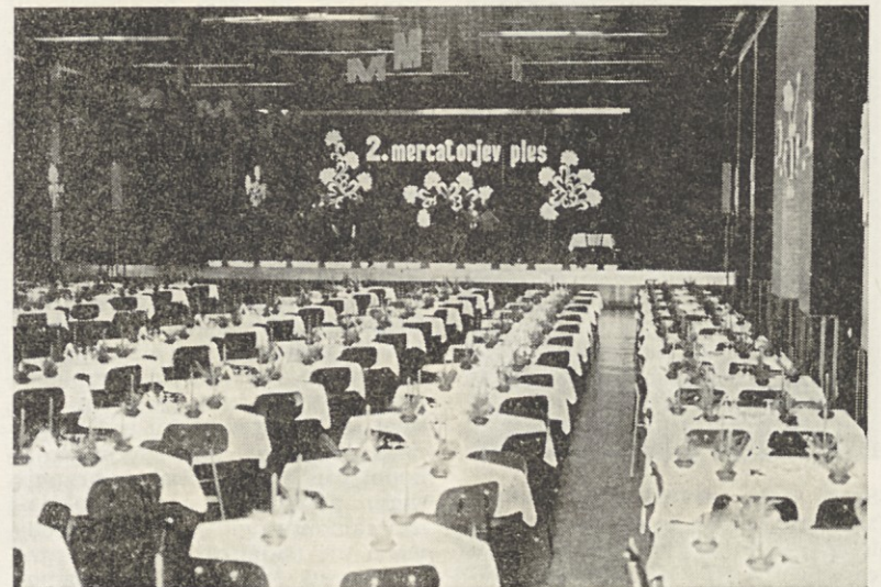
Takole slovesno pa je dvorana pričakala goste.