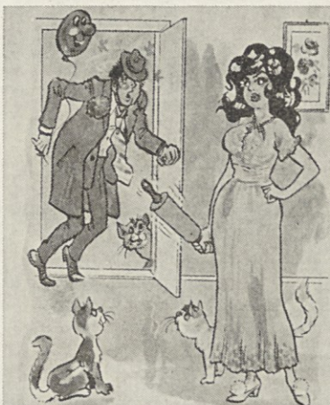
— Ti si pa res pridna, ženka, hk, če misliš ob tako pozni uri delati patico.