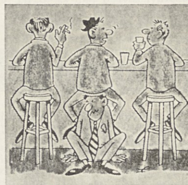
— Ravnokar premišlujem, kje neki tiči Polde.

Alma ne skrbi za linijo; nasprotno, prav rada je. Kaj ji najbolj tekne?