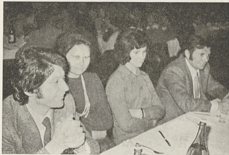
Štiričlanska delegacija Trgovskega podjetja Univerzal Lendava, bodoča TOZD Mercatorja, je sodelovala pri delu občnega zbora Panonije.