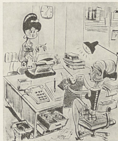
— Če bova še večkrat delali nadure, bom moj pulover lahko še dokončala.