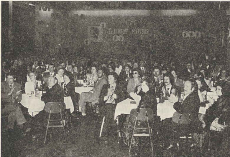
Nabito polna dvorana v Kidričevem je bila skoraj premajhna za tako prireditev.