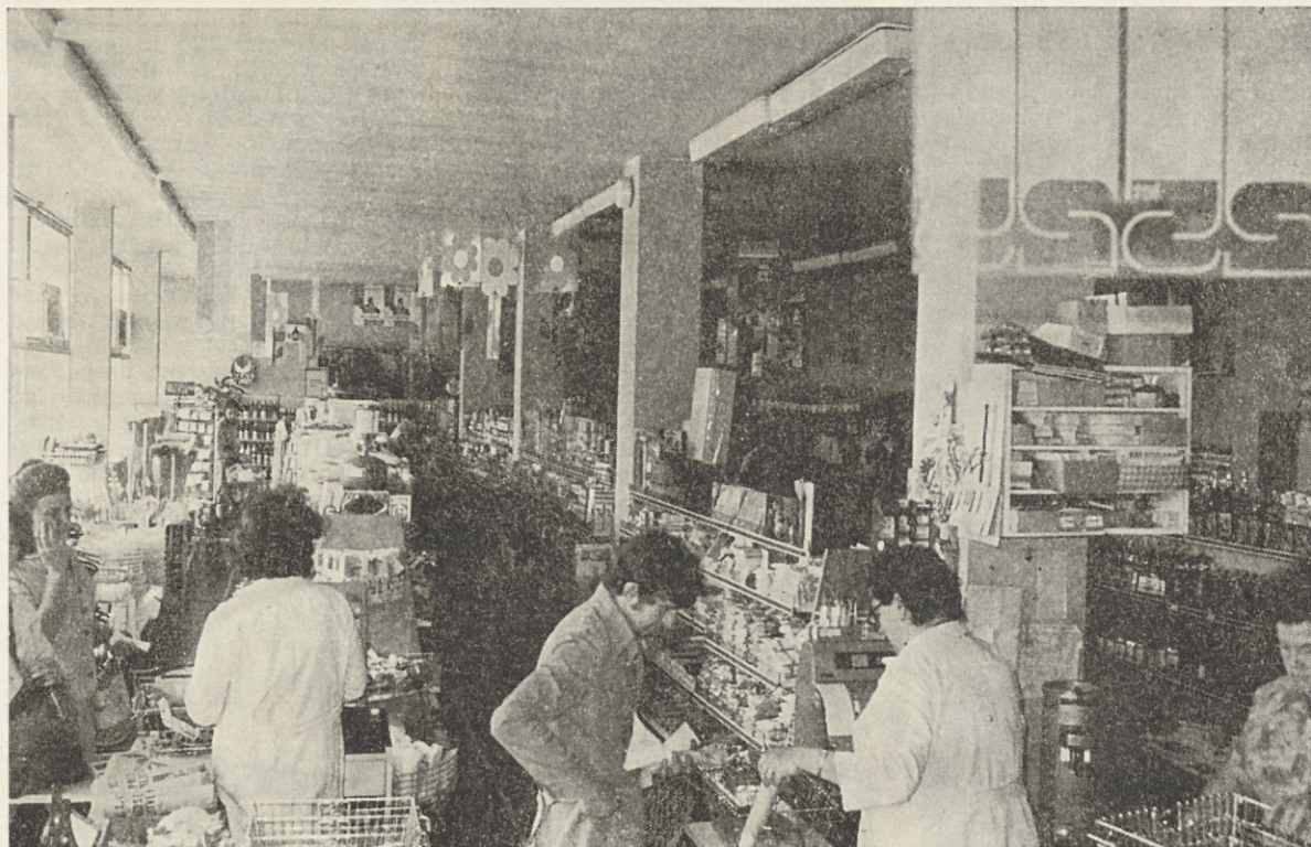
Samopostrežba na Proletarski je dobro založena, a žal iz dneva v dan premajhna.