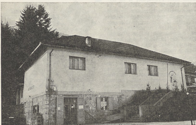
Takšnale izgleda prodajalna v Podturnu od zunaj; po tem pač ne bi sodil, da je notranjost tako lepo urejena.