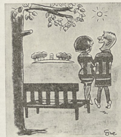
— Danes sem slišal dobro šalo, o nekem, ki se je usedel na sveže prepleskano klop...