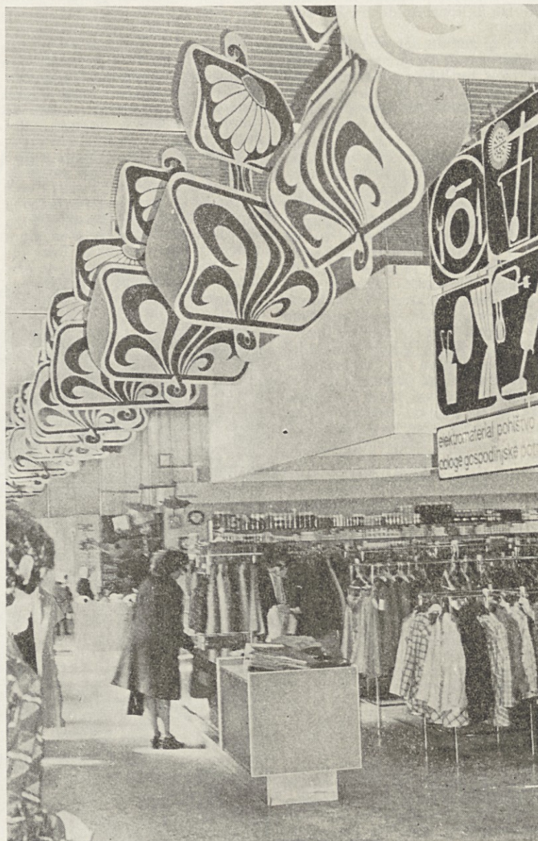
Spomladanska dekoracija je že zdavnaj nared in krasi naše prodajalne. Tokrat smo bolj zadovoljni, kajne? Takole na primer izgleda v tržiški blagovnici.