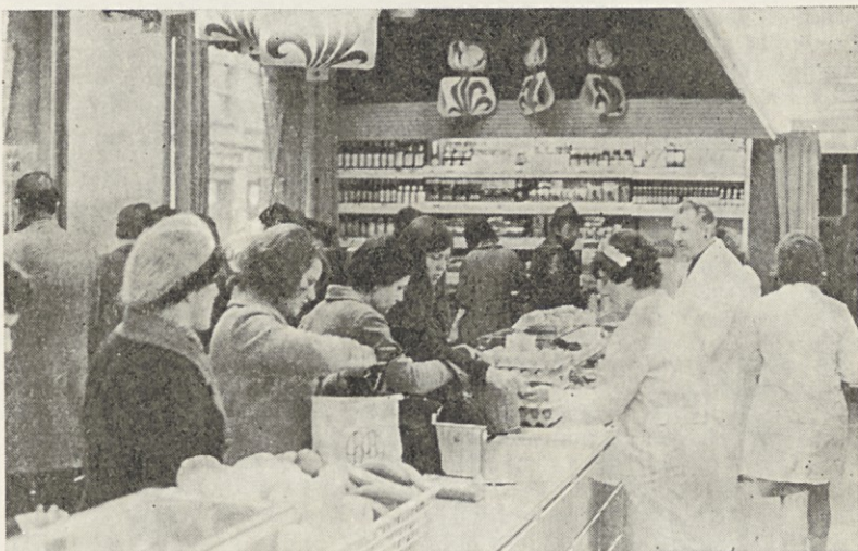
Ob sedmih se prodajalna odpre in hip za tem je že polna kupcev. Tako je vse do večera.