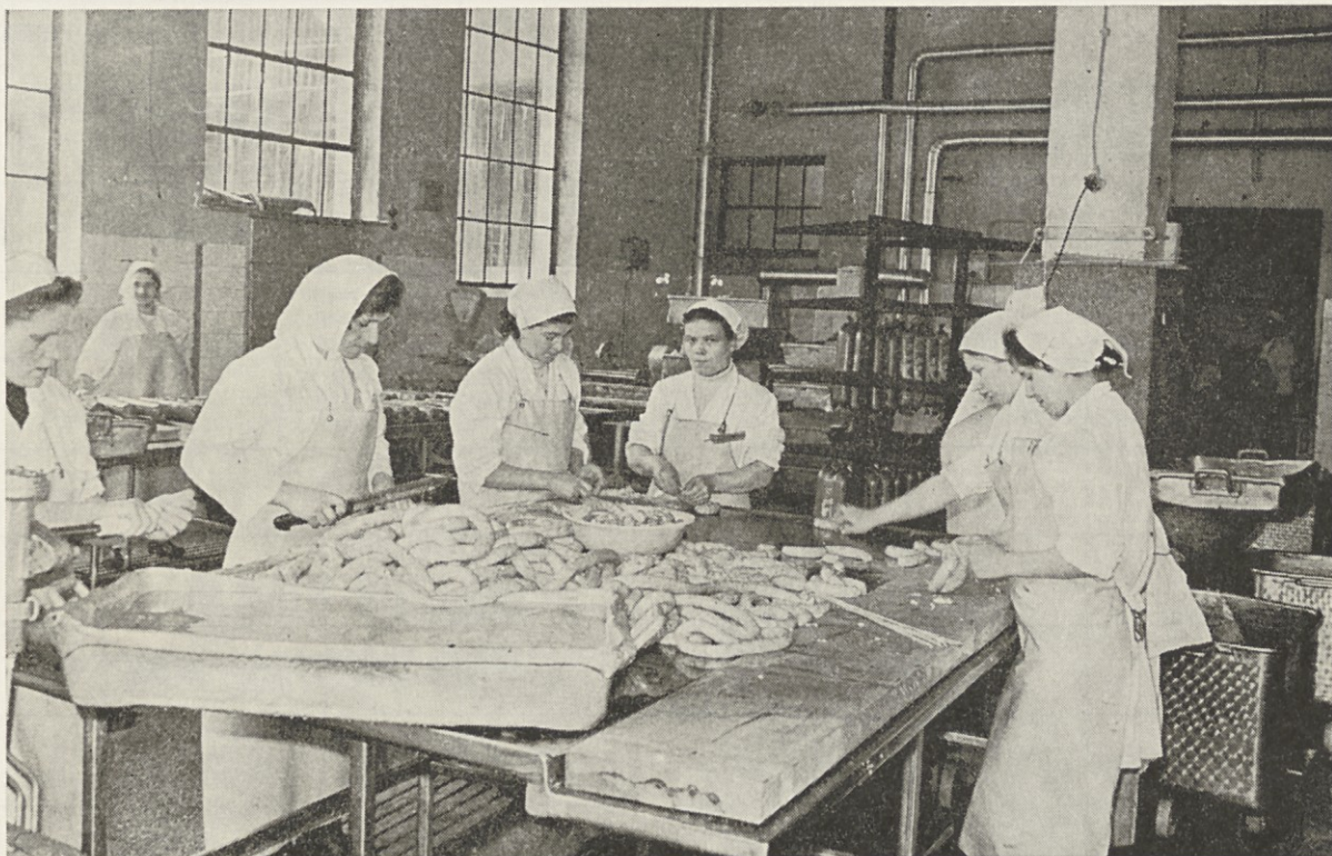
Delavke v predelavi pri pripravi kranjskih klobas.

Čestitamo, v imenu Pavlihe, ki obljublja še sodelovanje z nami, pa seveda tudi v imenu našega uredništva.