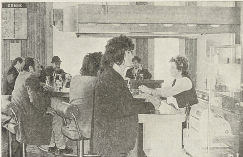
Motiv iz bifeja v tržiški blagovnici.