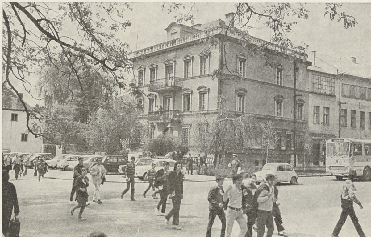
Takole so udeleženci »Pohoda po poteh partizanske Ljubljane« lani stopali mimo naše uprave na Aškerčevi. Prepričani smo, da bo letos med tisoči udeležencev tudi Mercatorjeva ekipa.