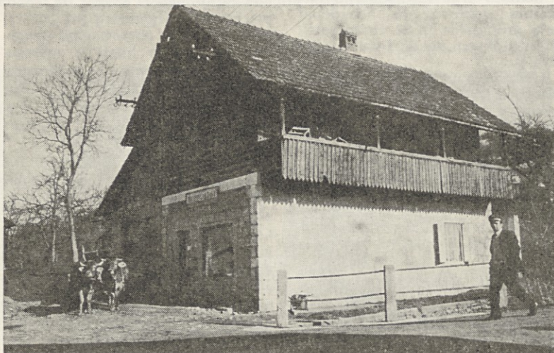
Tole je prodajalna v Gabrju pod Gorjanci. Nemalokrat pridejo kmetje nakupovat kar z volovsko vprego.