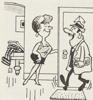
— Ko sem šel v trgovino, da bi ti kupil krznen plašč, je bil ta že prodan...