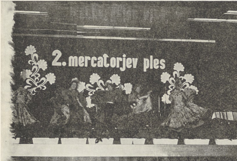
Mercatorjev ples v Kidričevem je otvorila baletna skupina iz Mari-bora s plesom kan-kan.

drugi Mercatorjev ples. Prvi je bil pred letom in kaže, da bodo s to