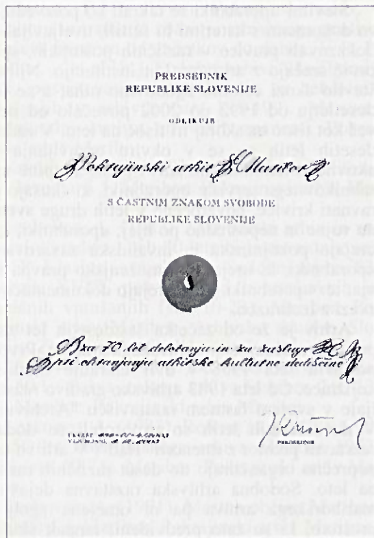
Priznanje s častnim znakom svobode Republike Slovenije Pokrajinskemu arhivu Maribor