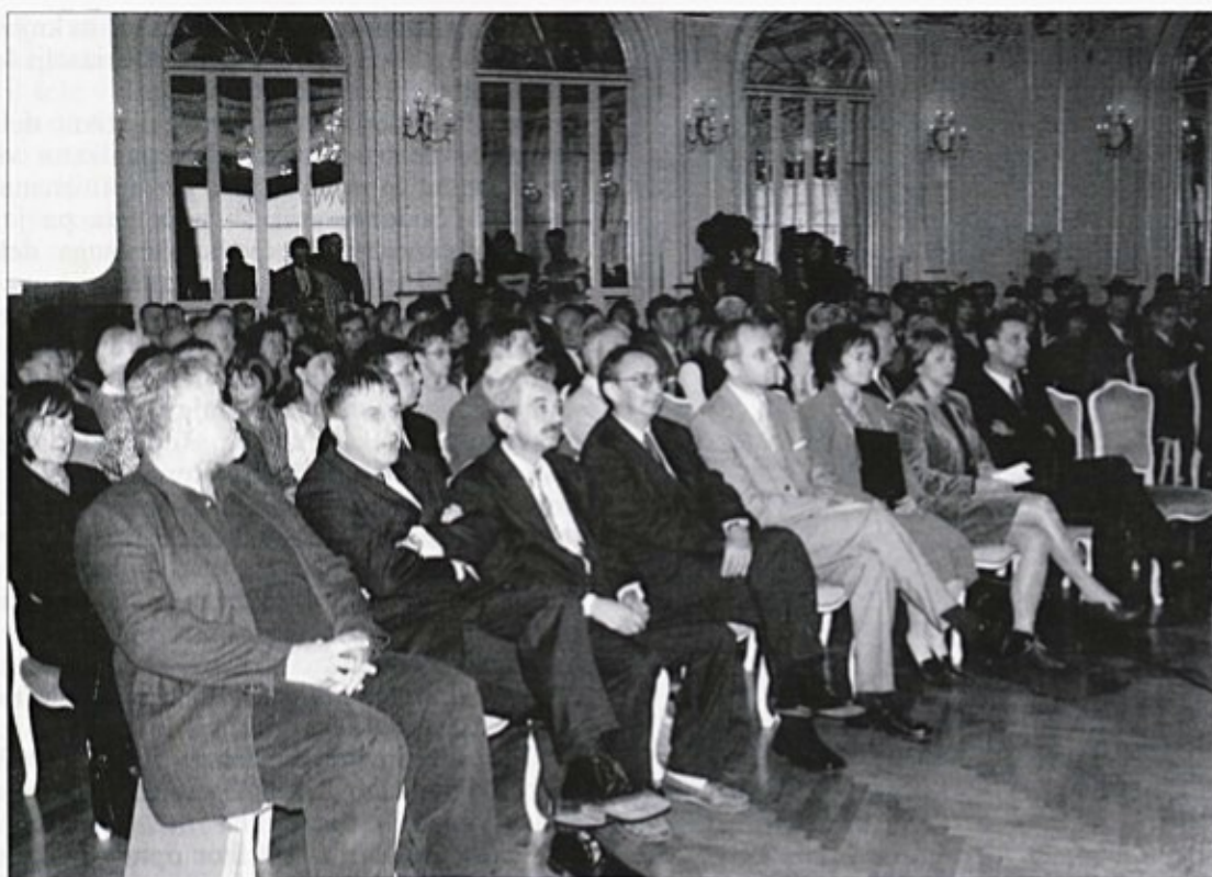
Pogled v dvorano na proslavi ob 70-letnici arhiva v Mariboru