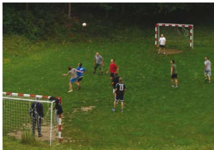
Kdo bo boljši?

Planirani dvodnevni planinski izlet so morali zaradi organizacijskih rešitev spremeniti v enodnevne. Kljub slabemu vremenu so osvojili Krn, si ogledali Krnsko jezero in dolino Lepene.