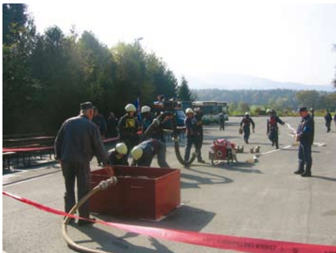
PGD so pokazala svoje znanje.

Gasilstvo na slovenskem ima dolgo tradicijo, ki je že več kot 100 let prisotna tudi na Moravškem. Moravska gasilska zveza je organizirana iz petih društev, že samo PGD Moravče šteje 187 članov in članic, vse od operative, mladine do veteranov. Zato je prav, da jim v mesecu Oktobru- mesecu požarne varnosti namenimo več besed.