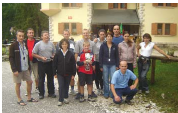
Pred pohodom na Krn

Poleg delovnih in športnih uspehov pa je razveseljivo predvsem dejstvo, da v društvu sodeluje staro in mlado in tako krepijo dobre medčloveške odnose.