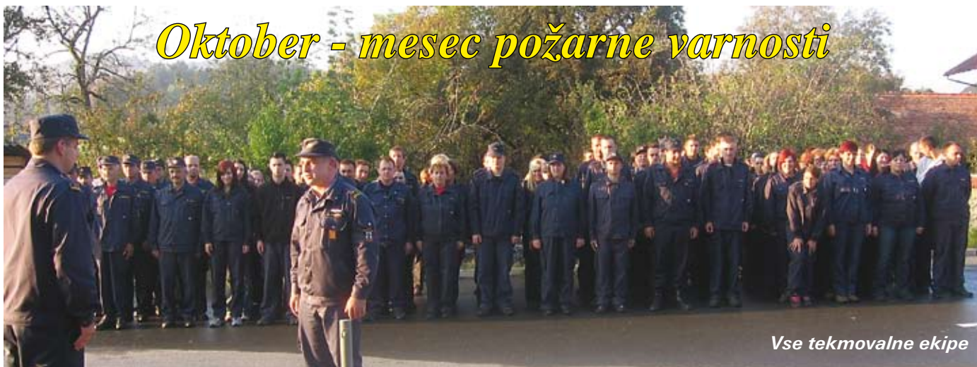
Vse tekmovalne ekipe

Gasilstvo na slovenskem ima dolgo tradicijo, ki je že več kot 100 let prisotna tudi na Moravškem. Moravska gasilska zveza je organizirana iz petih društev, že samo PGD Moravče šteje 187 članov in članic, vse od operative, mladine do veteranov. Zato je prav, da jim v mesecu Oktobru- mesecu požarne varnosti namenimo več besed.