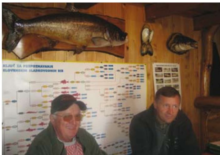
V koči ob ribnikih