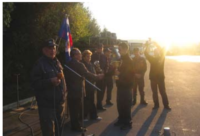
Prehodni pokal Staša Lebarja so si prislužili iz PGD Velika vas.

V okviru akcije Oktober-mesec požarne varnosti pa članice PGD Moravče pripravljajo tudi posvet in družabno srečanje regije Ljubljana-regije III. Prav tako je v okviru akcije načrtovan obisk osnovne šole v Moravčah, kjer gasilci otrokom prikažejo praktične stvari kot so uporaba gasilnega aparata v primeru gašenja, za nekaj razredov pa bo organiziran tudi ogled gasilskega doma. V tem mesecu pa je planirana tudi vaja celotne zveze, kakor tudi ločena društvena vaja. Posebnost obeh teh vaj pa je, da sta nenapovedani, z namenom determiniranja in eliminiranja pomanjkljivosti, kar pomeni dodatno izobraževanja in usposabljanja za gasilce in gasilke.