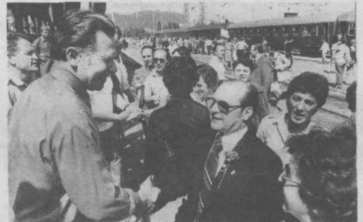
Rdeči nagelj v gumbnici in topel stisk rok – dva simbola tradicionalnega srečanja Rečanov in Ljubljancev. Okrog tisoč gostov z Reke je v soboto 14. junija odprtih rok sprejela Ljubljana. Na železniški postaji jih je pričakala razigrana množica.

Predstavniki krajevnih skupnosti Ajdovščina so najprej seznanili svoje goste z delovno organizacijo hotela Lev, ki jim je pripravila tudi manjšo zakusko. Pogovori so v sproščnem vzdušju potekali na kratkem izletu – gostje so si ogledali Pekel pri Borovnici in tehniški muzej v Bistri.