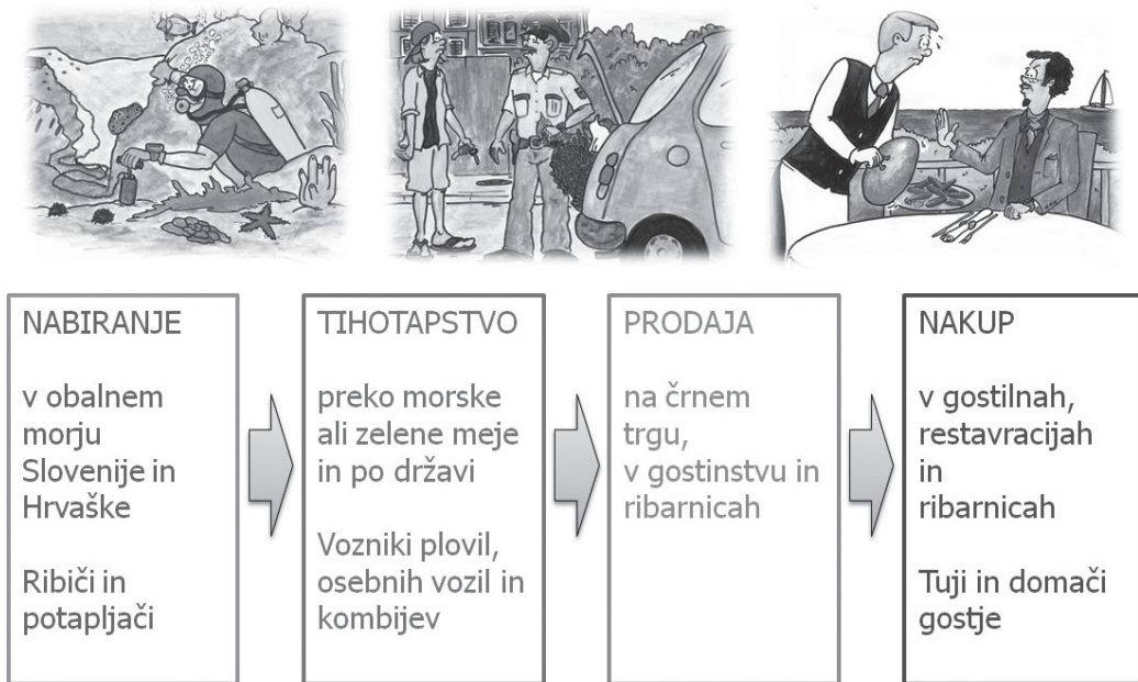
Slika 2: S komunikacijskimi in drugimi ukrepi smo posegli v različne segmente verige na poti morskih datljev iz morja na krožnik.

Figure 2: With communication and other measures, we intervened in different segments of the date mussel chain leading from the sea to the restaurant plates.