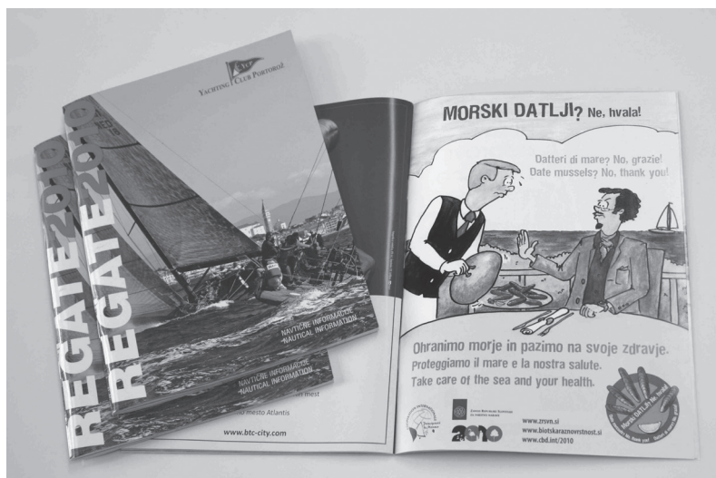
Slika 4: Oglas v brošuri jadranskega kluba je bil namenjen jadralcem, ki so ena pomembnih ciljnih skupin med potrošniki.

Figure 4: Advertisement in the brochure issued by a sailing club was intended for yachtsmen, who constitute one of the important target groups among date mussel consumers.