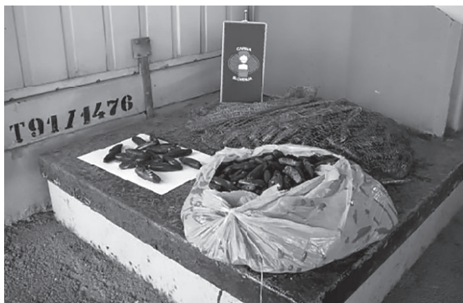
Slika 5: Fotografije tihotapskih pošiljk so komunicirale vidik prehranske varnosti, ključni dejavnik motivacije za spremembo obnašanja deležnikov.

V primerih, ko smo se odločili, da naravovarstveno problematiko vključimo v druge vsebine (npr. pri predavanjih za študente), smo se osredotočili na zanimivost. Tako smo npr. opozorili na dejstvo, da morski datlji potrebujejo 25 let ali več, da zrastejo do velikosti, ko so zanimivi za prodajo. Ob tem podatku so le redki ostali ravnodušni. Povezanost med dogajanjem v nevidnem svetu in našim življenjem na kopnem smo prikazali z razstavo Nevidne vezi . S predvajanjem videa smo deležnikom približali »nevidno« uničevanje morskega dna, s fotografijami zaseženih tihotapskih pošiljk pa školjke v higiensko oporečnih razmerah (slika 5).