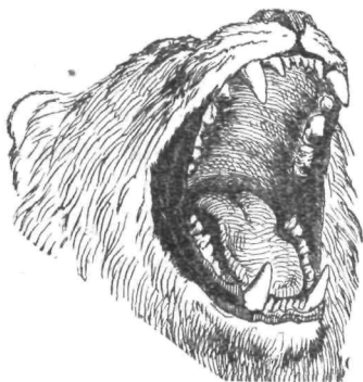
Rjoveči lev. †

in stresa grivo. S tem naznanja glad, ki se ga loti navadno vsakih dvanajst ur. Ako je že po dnevi z bližnjega griča zapazil v obližju kako zver, napoti se zdaj tja, drugače pa gre k vodi in sicer vedno proti vetru, da ga živali ne podišé in pridejo brez skrbi do vode. Svoj prihod naznanja lev s pretresujočim rjoventjem, katero primerjajo Arapi gromu, nazivajoč je »raad« (grom). Ako lev ne pripleni ničesar ob reki, odpravi se dalje k človeškim naselbinam, kjer preskoči nad 3m visok plot in se vrne po isti poti brez težave z dveletnim živinčetom, katero nese včasih po tri ure daleč, saj mu ne pripisujejo zaman moči 40 mōž. Naskoči kakor naša domača mačka. Najprej zdrobi živali vrat in se vpré vanjo s prvima nogama, silovito maha z repom. Na pol mrtva žival se zvija, krči in trepeta, a on zdaj in zdaj iztegne jezik in si oblizne gobec. Z ognjenimi očmi opazuje drgetajočo žival pod seboj ter včasih zarenči kakor pijan od zmage. Za nekaj časa jo izpusti, nato pa hlastno zadavi. Ako se mu naskok v prvo ne posreči, ne naskoči drugič. Nikoli ne zakolje več, kakor mu je treba. Navadno mu plena še ostane, ter se z ostanki gostijo in mastijo še druge zveri. Mirnost obnašanja, visoka postava in oster pogled človekov ga odvrne od napada. A kadar je lačen in si mora kobilic loviti, tedaj mu ne uteče človek tudi na najhitrejšem konju. Opomnje je vredno, da se otrók ne loti.