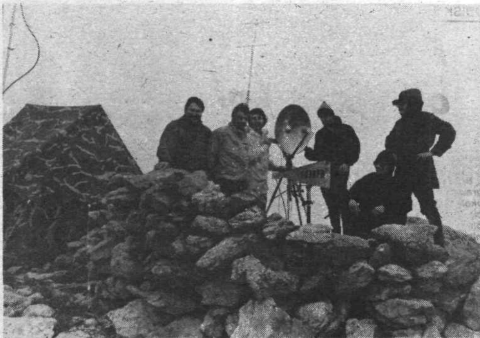
Del ekipe, ki je uspešno opravila delo na najvišjih frekvenčnih področjih.