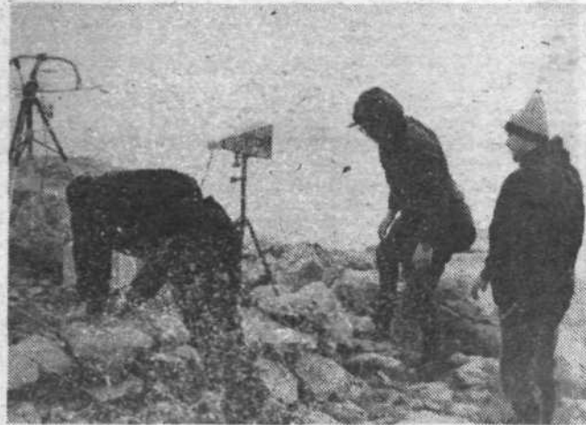
Potrebno je bilo postoriti še to in ono, popraviti kašno malenkost in pričrstiti šotore, da jih ne bi odnesel močan veter.