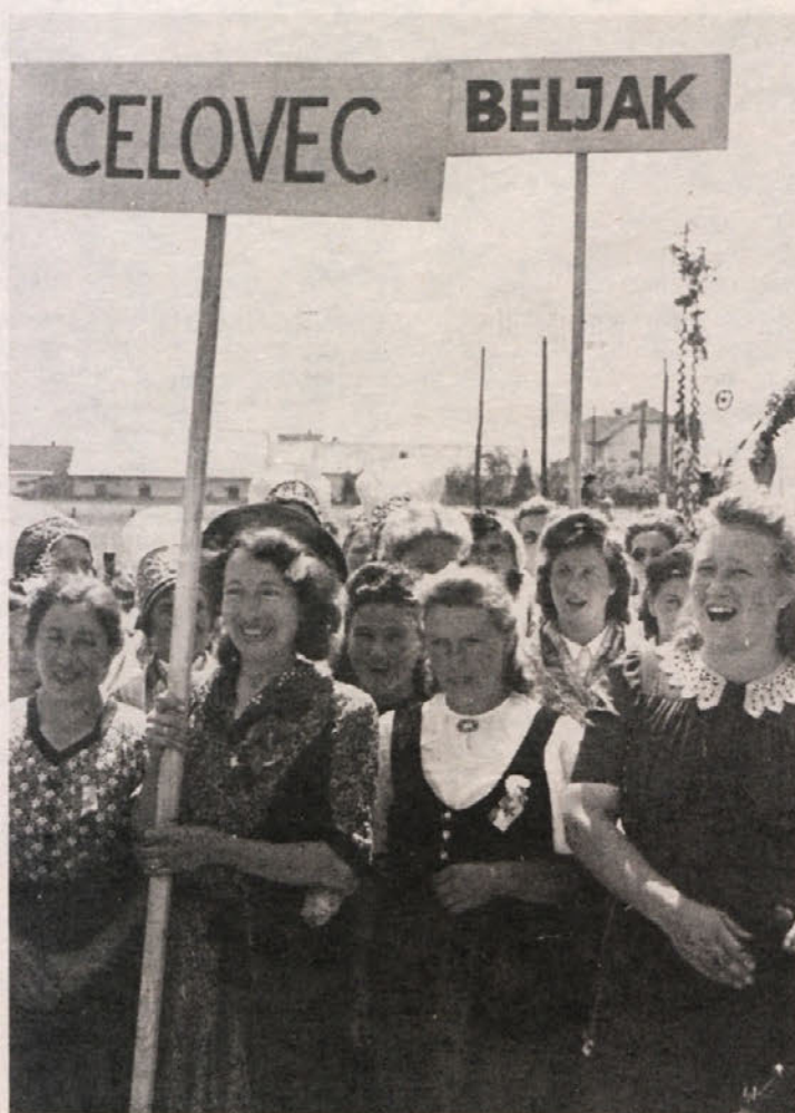
Koroške Slovenke na srečanju v Ljubljani junija 1945