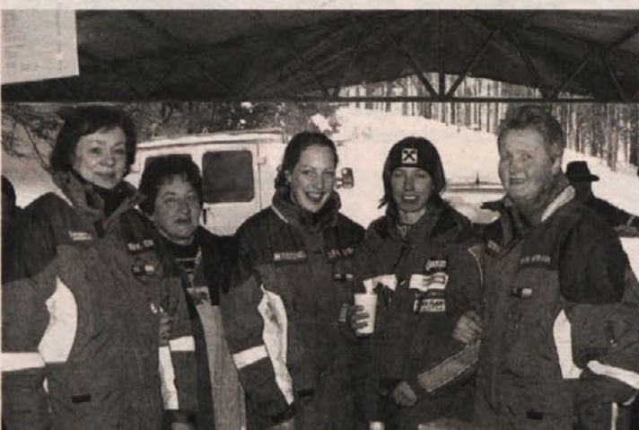
Avstrijska prvakinja v krogu žensk, ki so skrbele za dobrobit gostov

mačih tleh pomerili z odbojkarji Hypa iz Celovca. Vedno vroča tekma bo za gledalce gotovo prava športna poslastica. Domačini seveda pričakujejo zmago. Tekma bo 1. marca ob 19. uri. Vabljeni! M. Š.