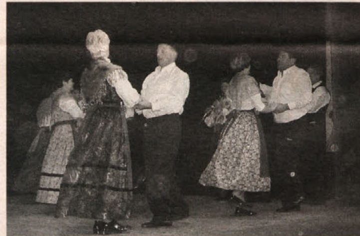
Folkloristi Kulturnega društva Prežihov Voranc

V torek, 18. februarja, je bilo v ravenskem Kulturnem domu srečanje v spomin velikega rojaka Lovra Kuharja – Prežihovega Voranca (1893–1950). Pripravila sta ga Javni sklad RS za kulturne dejavnosti, območna izpostava Ravne na Koroškem, in Kulturno društvo Prežihov Voranc, ki združuje folklorne plesalce, harmonikarje, zborovske pevce,