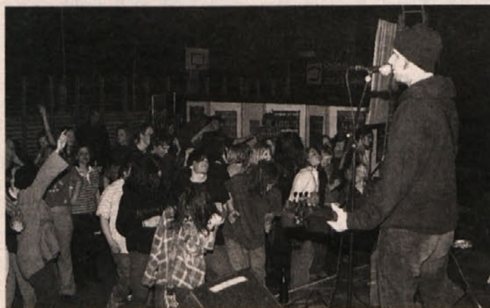
Ob vročih zvokih glasbenih skupin so mladi tudi zaplesali.