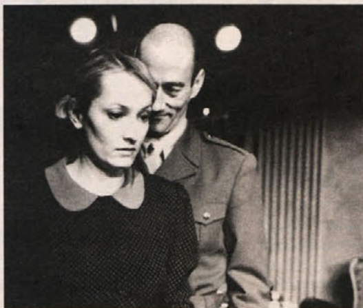
Na čigavi strani: slike z vaj (Mestno gledališče Ljubljansko)