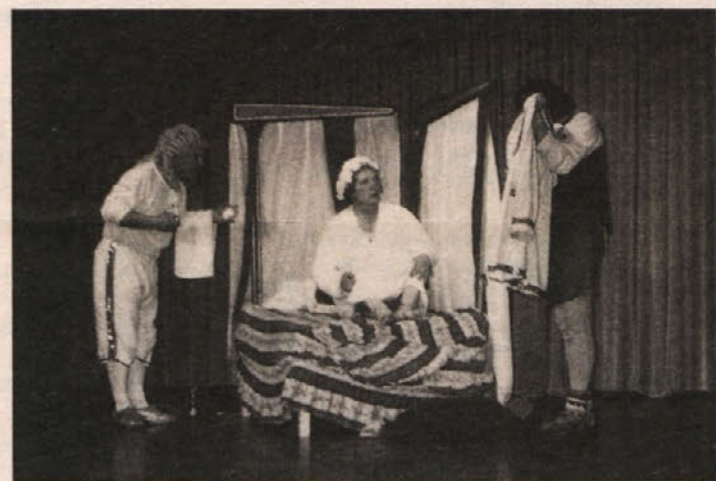
Jeppe se je prebudil v raj

Obiskovalci, ki jih ni bilo malo, so bili nad igro navdušeni. Bila je zabavna, smešna in lahko razumljiva. Jeppe bi re-