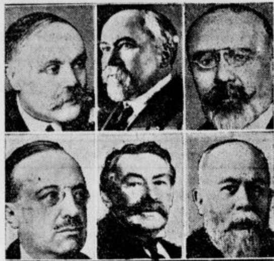
Clani novega Poincaréjevega kabineta: Zgoraj: minister za javna dela Loucheur, ministrski predsednik Poincaré in justični minister Barthou; spodaj: notranji minister Tardieu, zunanji minister Briand in finančni minister Chéron.

Gospod stotnik je res prišel. Zapovedal je najprej, naj stopijo vojaki skupaj, civilisti skupaj. Seveda je že od začetka posvečal več pozornosti vojakom. Izprašal je vsakega, kje, v kakih okoliščinah in kdaj je bil ujet. In ko je vsak po svoji poštenosti povedal vzrok svo-