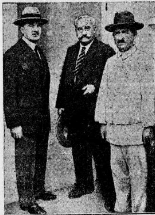
Nova rumunska vlada: ministrski predsednik dr. Maniu (levo) in ministra dr. Vaida in Mihalake.