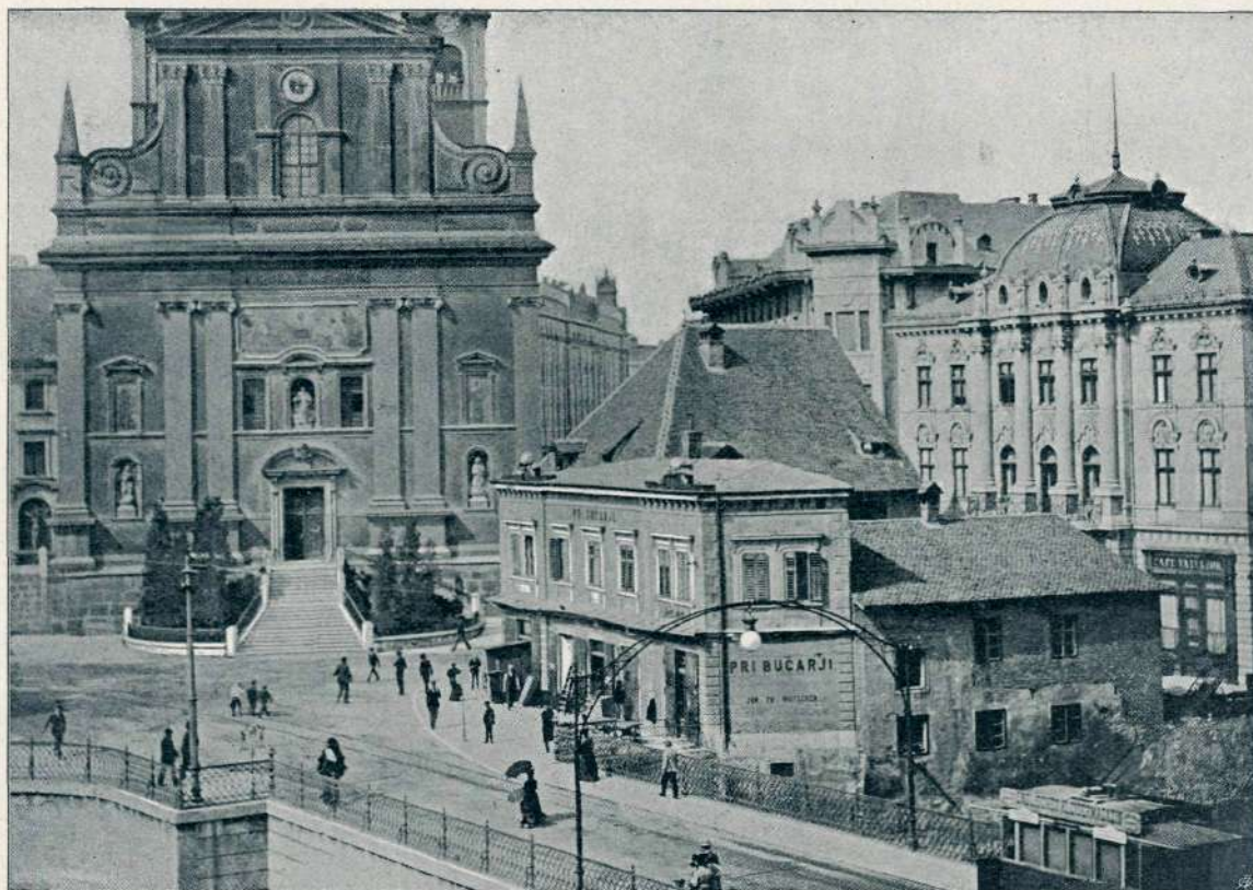
IZ „STARE“ LJUBLJANE: MARIJIN TRG.

Nova blejska cerkev je izvršena v gotskem slogu in mogočno povzdiguje lepoto tega krasnega letovišča.