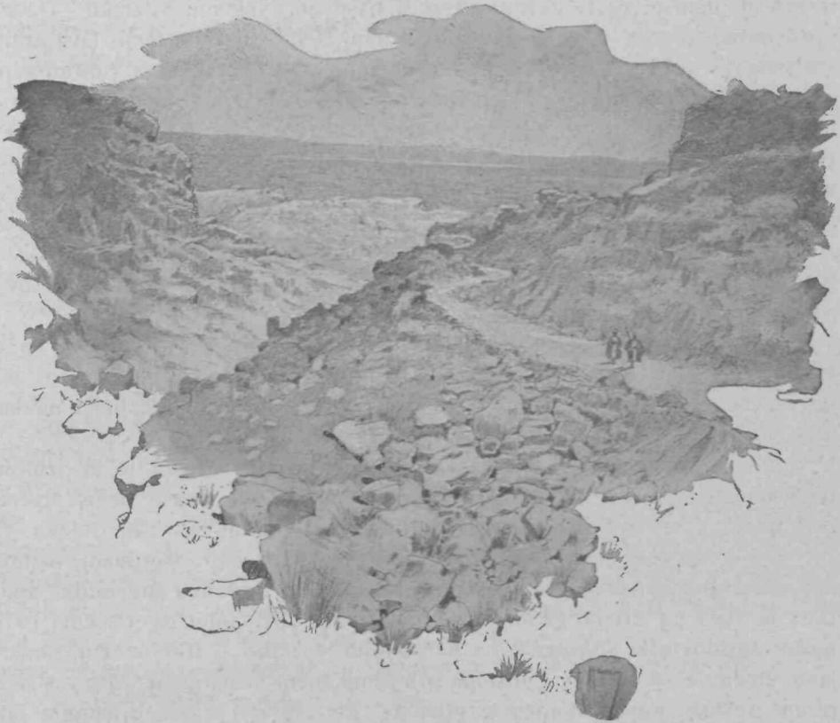
Puščava med Jeruzalemom in Jeriho.

Od tu dalje se nam je odpiral vedno otožnejši svet, prazno in kamenito gričevje, po katerem se vije slaba, prašna in izvožena cesta. Imeli smo pet do šest ur vožnje, pa cel čas ni bilo videti toliko zelenja, da bi mogel navadni kmetiški gospodar le enkrat nakrmiti z njim svojo živino. Razen