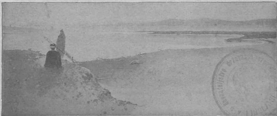
Ob mrtvem morju.

Obrežje Mrtvega morja je brez življenja, brez zelenja. Stara suha debla so nakopičena na severni obali. Morje jih je napojilo s svojo smolnato in slano vodo in jih potem vrglo iz sebe na suho. Mali valčki se zaletavajo zdajnzdaj ob peščeno obrežje in puščajo vselej belo mastno peno na pesku.