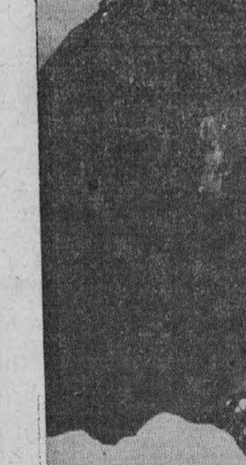
Nacij zapuščajo Greenlandijo. — Trikrat so že poskusili Nemci, da bi obnovili ali vzpostavili tam svojo vremensko opazovalnico, a vselej so jim to preprečili U. S. obrežni stražniki. Te svoje poskuse so bili Nemci na pravili v času od julija do oktobra. Na sliki je videti obrežne strožnike, ki preiskujejo nemško zapuščeno municije, orožja in drugega materiala.

Torej sedem let nisem doživel nobene javne kritike, razen ene, kar se je pa kar lepo zlepa razšlo, hvala Bogu. Vsak smo malo potrpeži, pa je šlo brez vseh nadaljnjih debat. In tako bi svet moral biti, pa bi ne bilo nobenega pobijanja in nobene morije. Saj smo vendar le od danes do jutri, kot kaplje na veji. Zakaj bi se prejedali, ko smo pa vsi smrtniki.