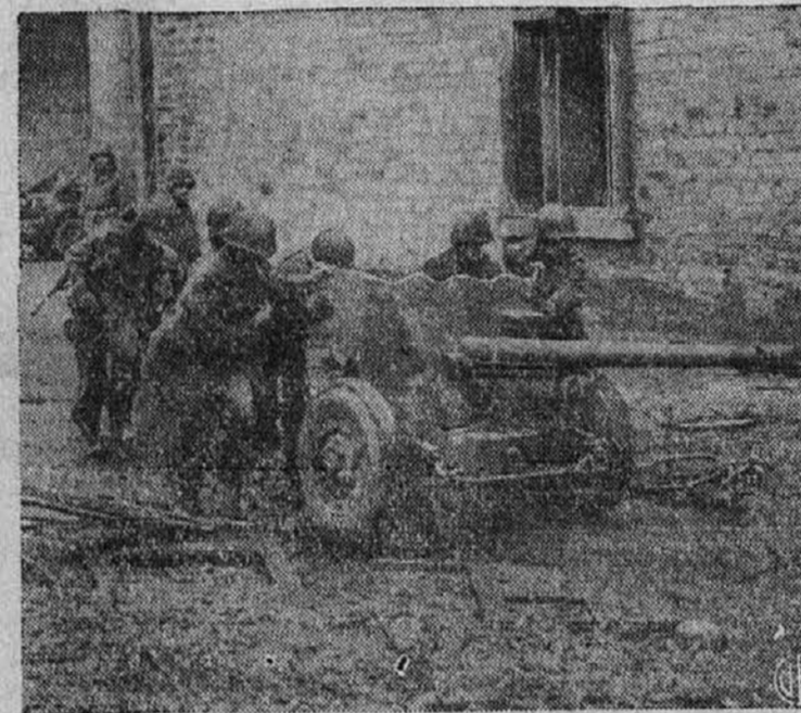
Slika nam predstavlja ameriške topničarje, ki postavljajo v pozicijo 57-mm top na cesti neimenovanega mesta v Saar okrožju v Nemčiji. Ta skupina je del general Pattonove 3. armade, ki se vedno bolj zajeda v nemško ozemlje.

NOVICE... z vsega sveta NOVICE... ki jih potrebujete NOVICE... ki jih dobite še sveže NOVICE... popolnoma nepristranske NOVICE... kolikor mogoče originalne NOVICE... ki so zanimive