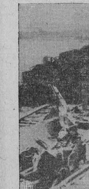
Trojna kolizija vlakov blizu Washingtona, D. C. — Dve milj južno od glavnega mesta sta najprej trčila dva tovarna vlaka in da je bila nesreča še bolj popolna, je pridrvel nato še osebni vlak in se zaletel v oba že prej prevrnjena vlaka. En strojevodja je bil ubit, 12 oseb pa je bilo ranjenih.