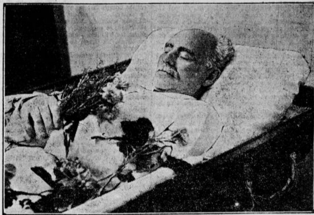
Hermann Sudermann na mrtvaškem odru.

skih obratov, ki obsegajo poprečno po približno 12 hektarov in v katerih domuje 120 milijonov mož, žena in otrok, ki delajo od rane mladosti do smrti. Obdelovanje zemlje je življenjski vir tega naroda. Rusija ima tretjino vse plodne zemlje na svetu. Pred vojno je izvažala 28 odstotkov vsega žita, 21 odstotkov vsega surovega masla in 95 odstot. vsega lanu na svetu, dasi je gospodarila še po starem načinu. Tudi ob slabem povojnem gospodarstvu more ruska zemlja še rediti svoje orjaške milijone in dajati tudi še nekaj za izvoz. 23 milijonov potrpežljivih in poslušnih kmetjskih družin, ki jim je mogoče odvzeti velik del sadov njihovega dela, je temelj neprimerljive trdnosti, na katerem morejo državni oblastniki brez skrbi uganjati svoje muhe in delati svo-