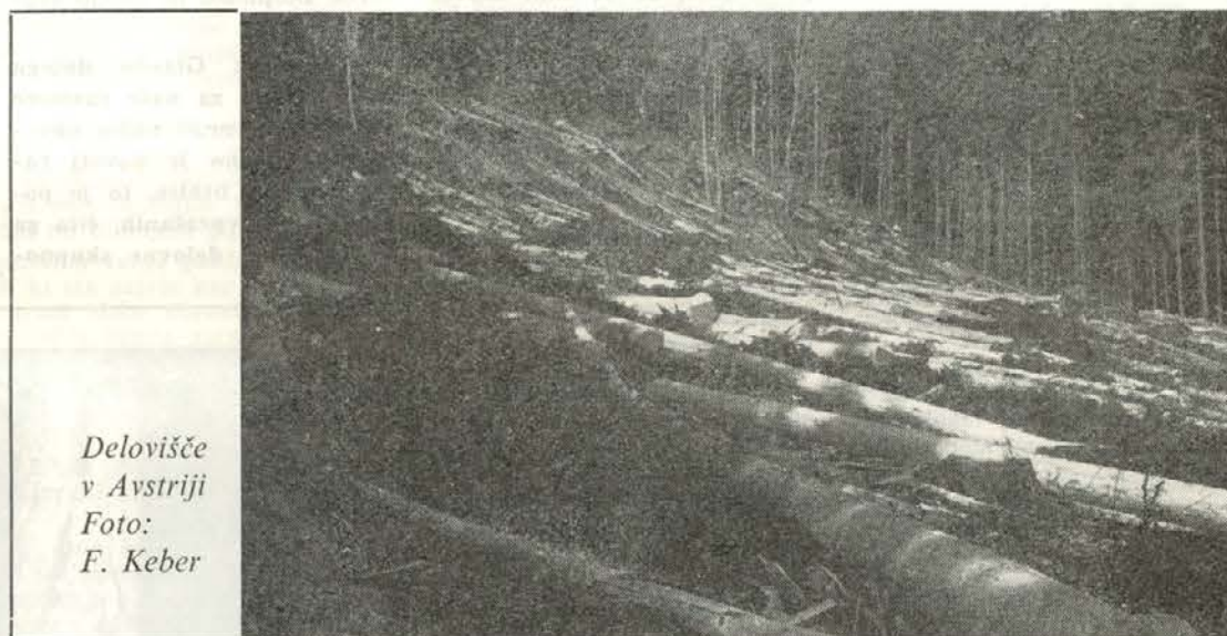
Delovišče v Avstriji

Odnosi njihovih revirnih vodij do nas so bili zelo dobri, saj so nam pomagali, če je bilo to potrebno. Kolikor vem, so tudi bili zadovoljni z našim delom. Franjo Keber