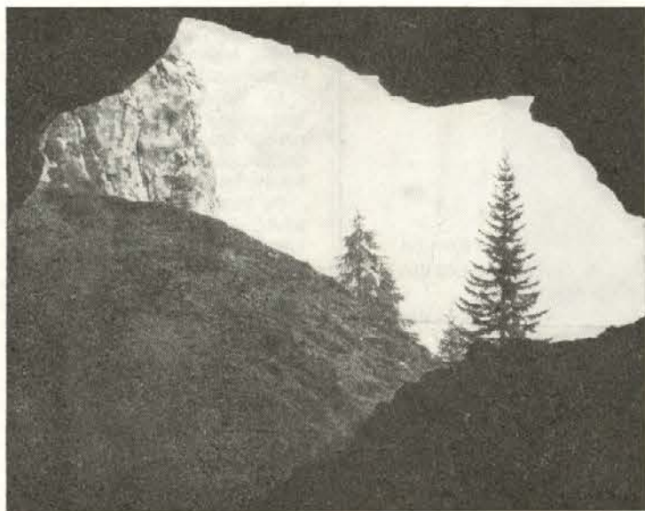
Potočka zijalka na Oiševi