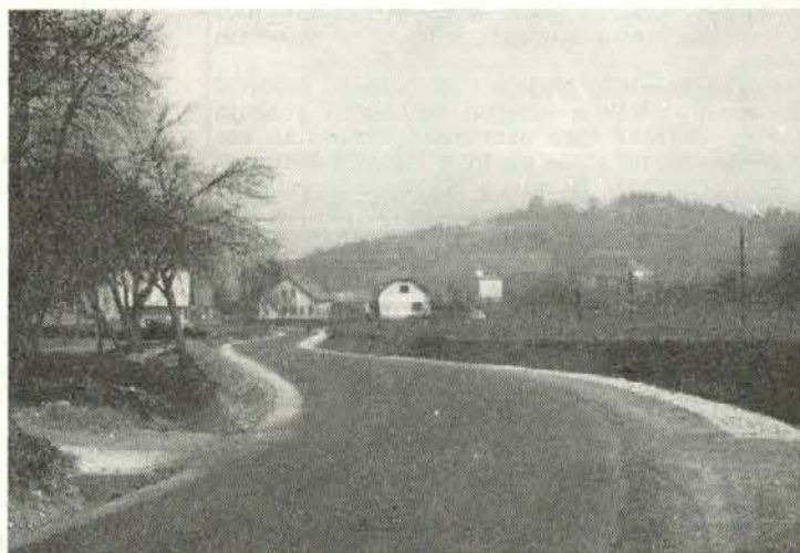
Kotlje — Rimski vrelec