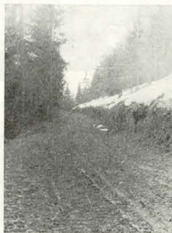
Odpiramo nova območja