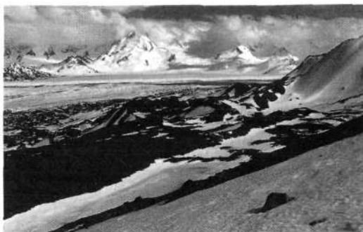
Prehod z ledenika pod Vetrno sedlo (Passo Viento)

Zadnji dan tega popotovanja ga je čakala še dolga pot do vasi Chalten, večidel po stezi, kajti tod že pogosteje hodijo ljudje. Po treh kilometrih po gozdovih in močvirjih je prišel do razpotja, kjer bi se lahko odločil za pot čez hribe, pa se je za tri ure daljšo in slabšo, a fotografsko zanimivejšo različico. Po enajstih urah hoje je že v trdi noči prišel približno uro pred vas Chalten, kjer je še enkrat postavil šotor, da bi naslednje jutro še od tod fotografiral, kar bi se mu postavilo pred objektiv. Šesti dan potovanja je tako zvečer prišel v vas, ostal tam ves naslednji dan, da bi fotografiral Cerro Torre, a se mu je skrll in se spet pokazal šele dan pozneje. Ta dan je samotni slovenski popotnik najel konja in gaučo je šel z njim, isti Rodolfo Guerra , ki je slovenski odpra-