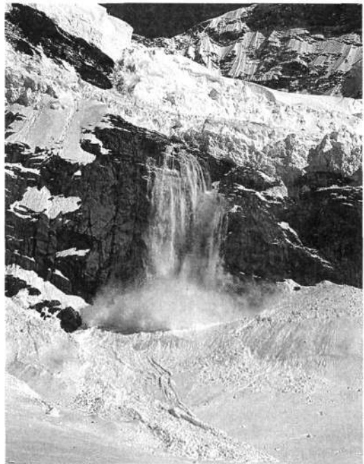
Strašljivo je bilo, ko so se nad potjo podirali kot hiše veliki seraki, ki pa na srečo niso dosegli smeri, po kateri je hodil samotarski gorohodec.

Levo od njegove smeri so se ves čas z mogočnim hru-