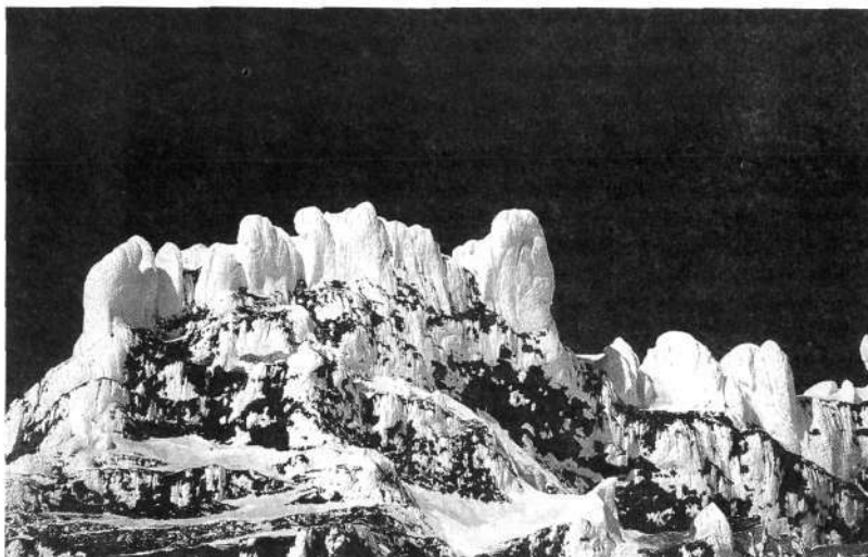
Cerro Marconi, ovešen z nevarnimi seraki

januarja, kot smo mislili do zdaj, ampak tudi že prej – sam sem podnevi hodil po ledu celo brez rokavic.«