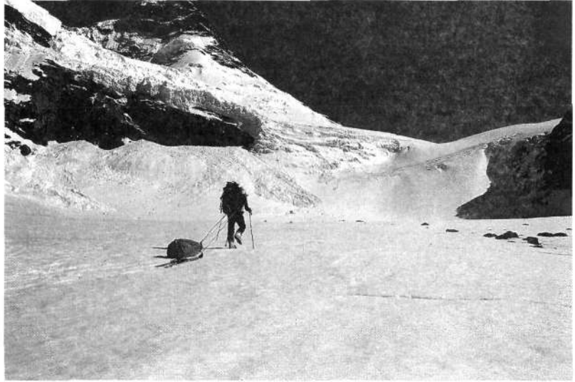
Osamljeni popotnik pod prelazom Marconi: lepo je bilo potovati s smučmi na nogah in za seboj vleči transportno vrečo, teže je bilo z vso prtljago na hrbtu iskati prehode po ledeniški groblji.