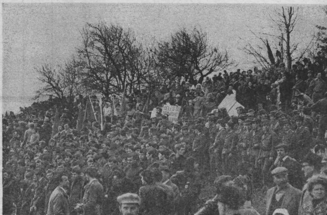
Proslave se je udeležilo več tisoč ljudi iz vse republike.