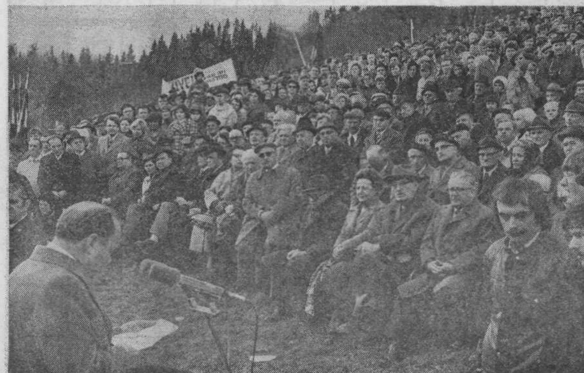
Priseditvi so prisostvovali številni družbenopolitični delavci in udeleženci ustanovnega kongresa.