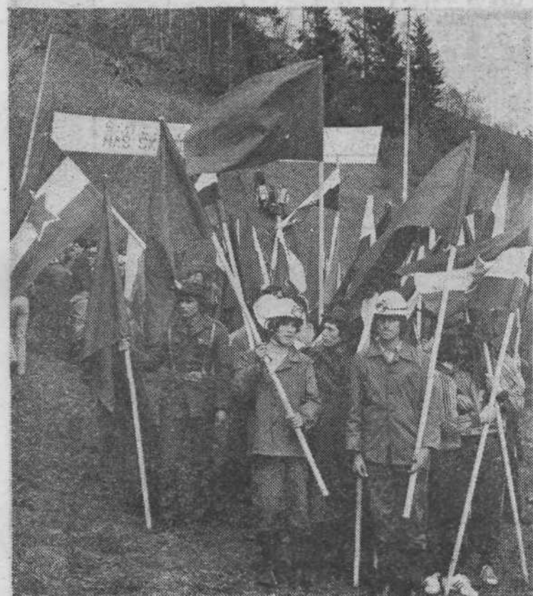
Spremljevalci štafete pričakujejo predajo štafetne palice.