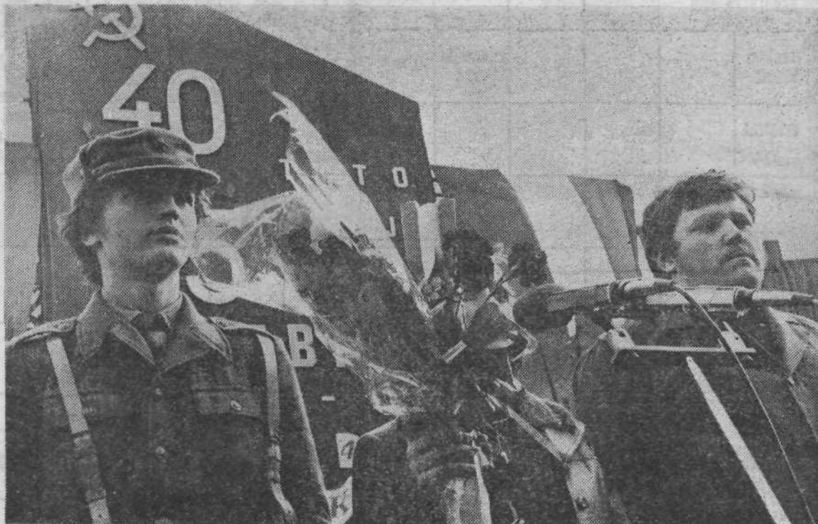
Udeleženci proslave so toplo pozdravili Titovo štafeto, ki je letos prvič obiskala zgodovinske Čebine.