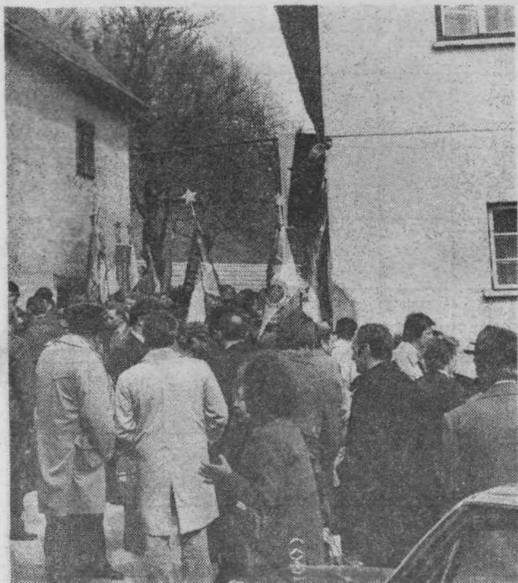
Udeleženci proslave pred Barličevo domačijo na Čebinah, kjer je bil pred štiridesetimi leti ustanovni kongres KPS.