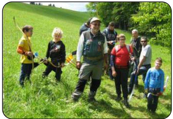
Najmlajše je vodil najizkušenejši.

Turjaški lokostrelci smo v nedeljo, 8. maja, organizirali tretjo tekmo za pokal tradicionalnih lokov. Pokal je nov, tekmovanja so običajno v terminih, ki jih ne zasedajo tekme za 3D- in Arrowhead pokal. Na lep nedeljski dan, idealen za tekmo, se nas je zbralo skoraj šestdeset lokostrelcev iz Slovenije, Italije in Hrvaške. Prevladovali so lokostrelci z dolgim lokom in instinktivnim lokom, kar je tudi namen pokala. V gozdu in na travniku pod gostiščem Rozika je bila postavljena proga – 14 živalskih tarč, ki smo jih morali lokostrelci obhoditi dvakrat in streljati na živali z dveh različnih razdalj. Proga je bila zanimiva, teren dovolj razgiban, tarče na ravno pravšnjih razdaljah, tako da je bilo treba pokazati kar nekaj lokostrelskega znanja.