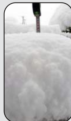
Utrinki z Male Slevice Foto: Anton Zakrajšek, 28. april 2016