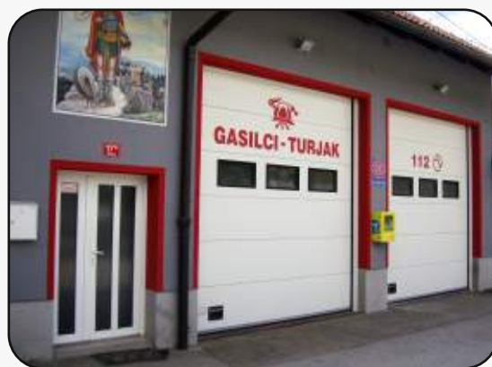
Mesto namestitve na gasilnem domu Turjak

različne, vendar imajo enako funkcijo, in sicer z električnim sunkom spodbuditi srce k ponovnemu delovanju. Med seboj se razlikujejo predvsem naprave, ki so namenjene profesionalnemu (zdravstvenemu) osebju, in tiste, ki so namenjene splošni uporabi na javnih in drugih mestih. Pri tem je treba poudariti, da je AED naprava samo v pomoč pri temeljnih postopkih oživljanja (TPO), in ne nadomešča strokovne zdravstvene pomoči. V prihodnjih dneh se bomo gasilci PGD Turjak strokovno izpopolnjevali za uporabo defibrilatorja, kasneje pa znanje prenesli tudi med občane. Ob uporabi je nujno potrebno obveščanje na številko 112, da pomoč prispe v najkrajšem možnem času.