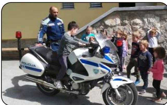
Zanimiva in poučna predstavitev policistov PP Ribnica

vso opremo in sireno, opremo policista specialne enote, na koncu pa so vsem, ki smo se pridno pripenjali z varnostnim pasom, izročili posebno nagrado.