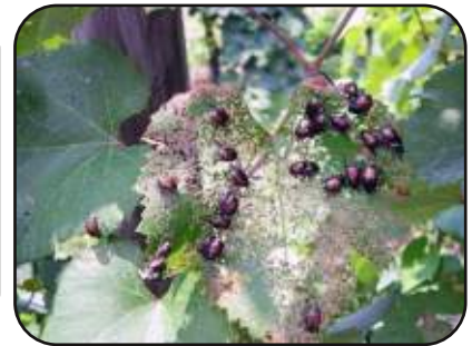
Odrasli hrošči izjedajo listno tkivo med listnimi žilami vinske trte.