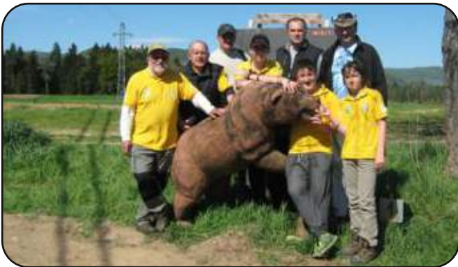
Uspešna turjaška ekipa

Lokostrelska sezona je v polnem teku in tekem se udeležujemo tudi člani Lokostrelskega kluba Turjak. V soboto, 16. 4. 2016, smo se odpravili v Ložnico pri Žalcu, kjer je domači lokostrelski klub Sokol organiziral letošnjo drugo tekmo za 3D-pokal.