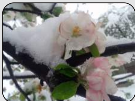
Poznoaprilski zasneženi sadovnjak 28. april 2016