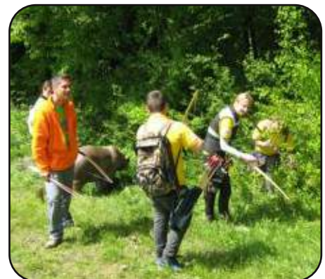
Mnogi so morali iskati tudi zgrešene puščice po grmovju.