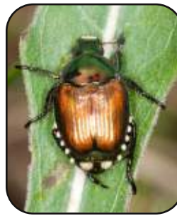
Odrasli osebki japonskega hrošča Popillia japonica

Hrošči se hranijo tudi s sojo, povzročajo sušenje in odpadanje listov na beluših, vinski trti ter številnih sadnih vrstah (jablane, češnje, breskve, slive, nektarine, maline). Podobno kot hrošči so nevarni tudi ogrci, ki se v velikem številu pojavljajo predvsem na dobro vzdrževanih zelenicah in golfiščih, manj številčni pa so na ekstenzivnih travnikih in pašnikih. Ogrci se prehranjujejo s koreninami rastlinskih vrst in uničujejo travno rušo v obliki otokov, podobno kot poljski majski hrošč. Prva znamenja napada so neznatna, videti so kot posledica suše in se kažejo kot počasna rast, porumenelost in sušenje travne vegetacije. Posredno škodo povzročajo divji prašiči in ptice, ki z ritjem ali kako drugače poškodujejo travno rušo, medtem ko v njej iščejo ogrce za lastno prehrano.