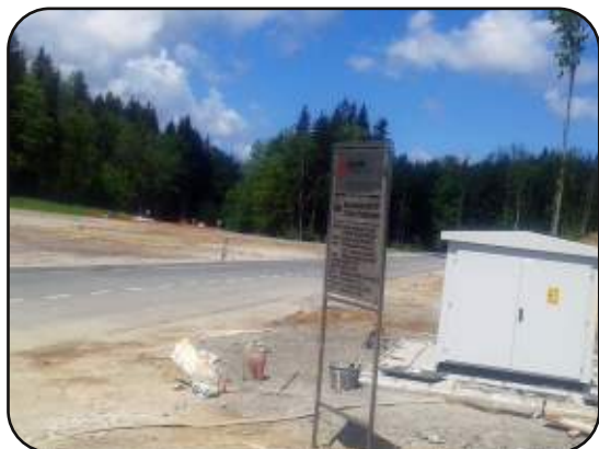
Transformatorska postaja v poslovni coni

V letošnjem letu je do poslovne cone Javno podjetje Elektro iz obstoječega 20 kV daljnovoča Velike Lašče v skladu z gradbenim dovoljenjem pripeljalo električno energijo. Na robu južnega dela ureditvenega območja že stoji transformatorska postaja TP za obrtno cono z močjo 630 kVA, iz katere se bodo lahko napajali bodoči odjemalci.