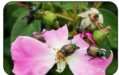
Poškodbe na cvetu vrtnice

Nekatere gostiteljske rastline japonskega hrošča sodijo med najpomembnejše gojene rastline pri nas. Upoštevajoč te dejavnike, ocenjujemo, da bi bil morebitni negativen učinek tega škodljivega organizma (ogrci na traviških in odrasli hrošči na drugih rastlinah) na skoraj celotnem območju Slovenije precej velik.