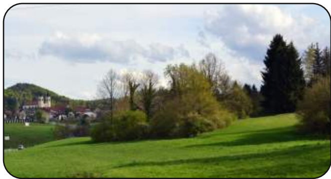
Za grmovjem se skriva Šumnik

Eden izmed glavnih ciljev študijskega krožka Naš kraj včeraj, danes, jutri je, da velikolaške kraje ne spoznavamo samo iz knjig na predavanjih, ampak da gremo tudi na teren. Tudi letos nadaljujemo s prakso izletov, ki so rezultat dela vseh članov.