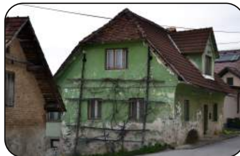
Vas Male Lašče