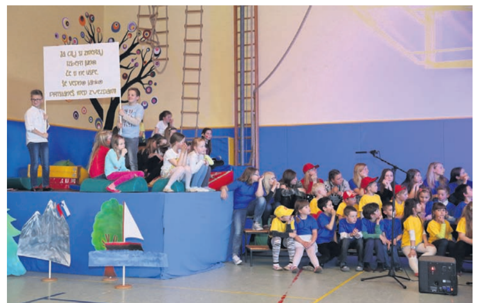
Breški osnovnošolci so v čast svoji šoli skupaj z učitelji pripravili čudovito prireditev.