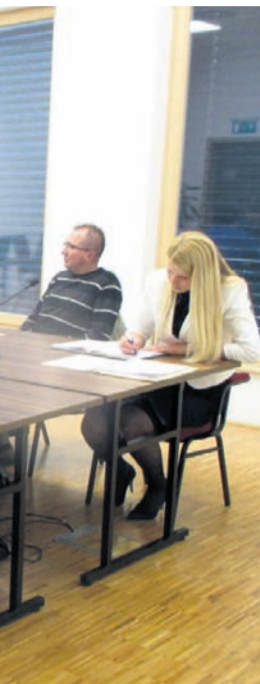
Foto: EM svetniki še razpravljali.

naprav na območju občine. Podrobnosti sicer še niso dorekli, vendar naj bi