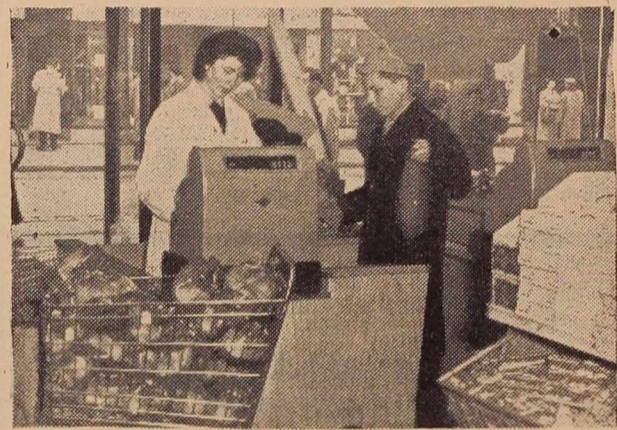
Samopostrežna trgovina — znak napredka

○ Dalje so v razpravi pristotni poudarili potrebo po čimprejšnji dograditvi vajsenske trgovske šole v Murski Soboti,