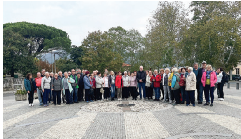
Postanek na Trgu Evrope v Novi Gorici

Po končanem ogledu uničevalnega taborišča v Rižarni sta sledila obisk Bazovice in ogled spomenika pobitim tigrovcem. Zaradi protifašistične dejavnosti so bili