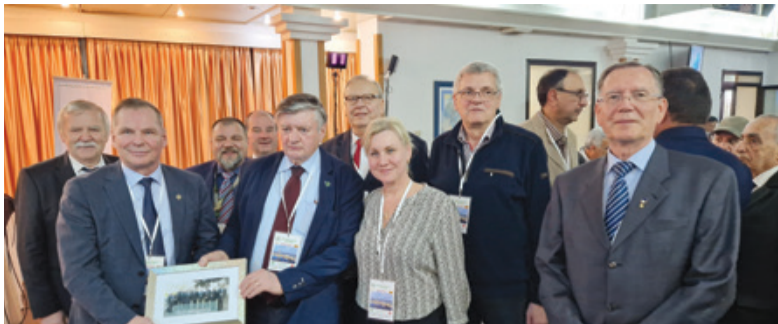
Slovenska delegacija v Beogradu