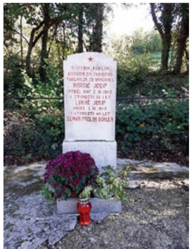
Spomenik po obnovi