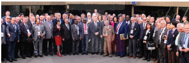
Udeleženci kongresa pred Hišo cvetja v Beogradu

Za ZZB pa je bil še dodatno in posebno koristen tudi poseben delovni sestanek s predstavniki drugih borčevskih organizacij z območja nekdanje skupne države in sprejeti dogovori o delovanju v tem letu. Marjan Šiftar