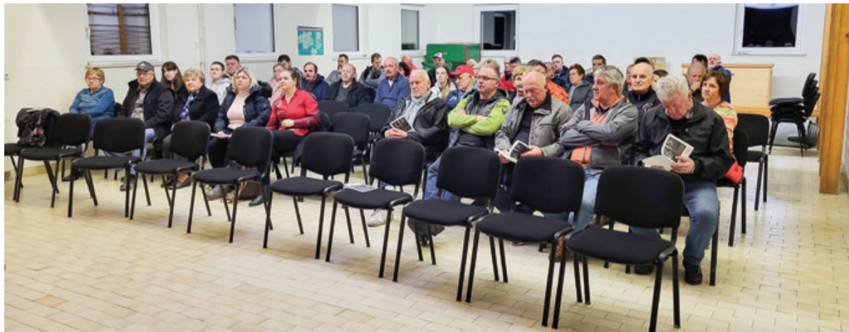
Predstavitve knjige Pomniki viharja v gasilskem domu.