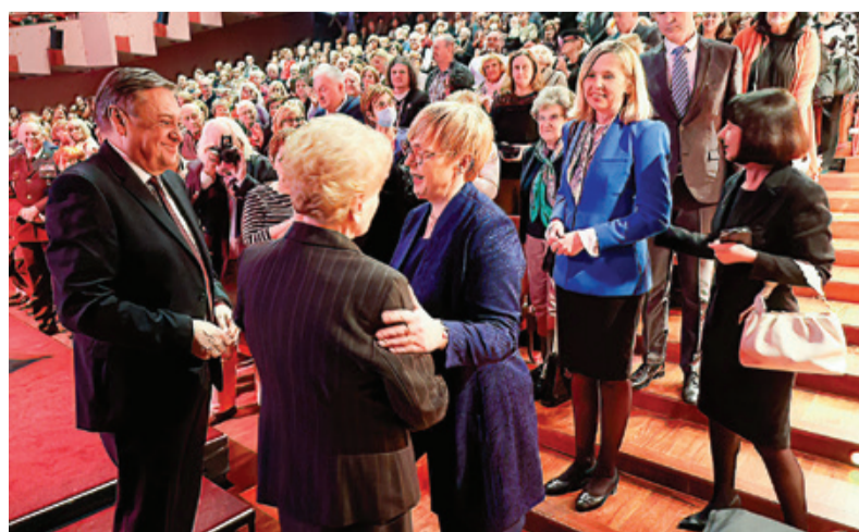
Udeleženci tradicionalne prireditve v Cankarjevem domu