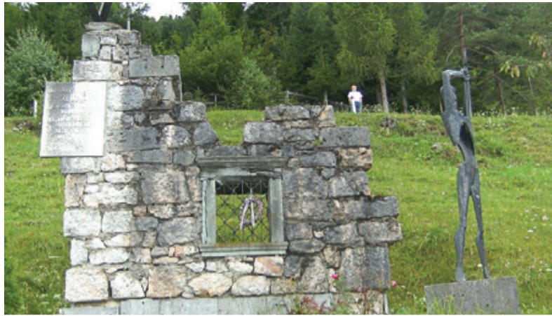
Spomenik požigu Jamnika

Očeta so dodelili v Vojkovo brigado. Bil je pomočnik mitraljezca, streljal pa ni, ker ni služil vojaškega roka. Spali so na mrazu, v vlažnem listju, tako da je zbolel za hudo pljučnico, a se je neki zdravnik iz Celja zavzel zanj in ga ozdravil. Med prvimi je vkorakal v osvoboje-