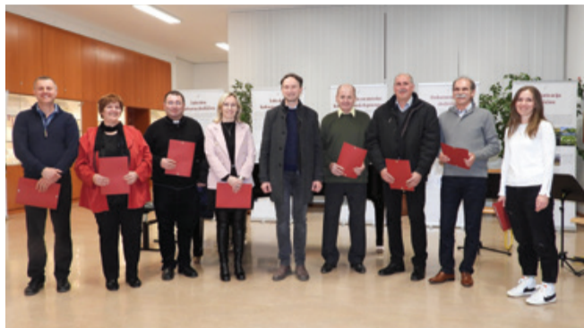
Med dobitniki priznanj je bilo tudi Zdrženje borcev za vrednote NOB Trebnje.

Novomeška območna enota Zavoda za varstvo kulturne dediščine Slovenije se je 13. februarja z razstavo v Centru za izobraževanje in kulturo Trebnje predstavila z delom in projekti, ki so rezultat strokovnega dela in prizadevanj zaposlenih konservatorjev, restavradorjev in drugih strokovnih sodelavcev v zadnjem desetletju. Posamezne pomembnejše varstvene dejavnosti in izbrani obnovljeni spomeniki omogočajo vpogled v problematiko in izzive spomeniškovarstvenega dela v jugovzhodnem delu Slovenije.