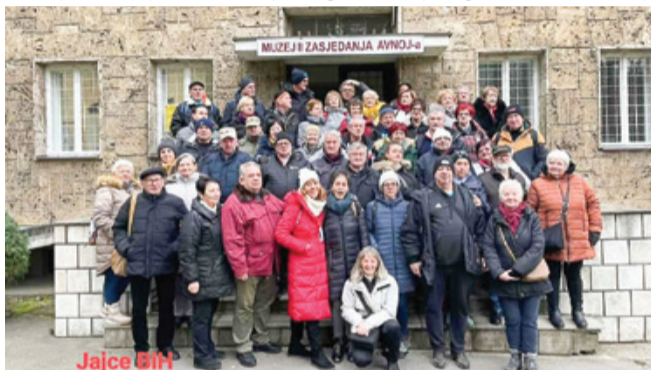
Zagorjani pred muzejem drugega zasedanja AVNOJ-a v Jajcu

Obisk proslave je bil del tridnevne ekskurzije, v okviru katere so Zagorjani obiskali tudi muzej AVNOJ v Jajcu in se udeležili podpisa listin s pobrateni občinami Tešanj, Konjic in Jajce. V Tešnju smo najprej položili venec pri spomeniku padlim, potem pa v prijetnem druženju in ob gostoljubju članov združenja antifašistov »Josip Broz Tito« preživeli kar nekaj prijetnih uric. V Konjicu smo se prav tako poklonili padlim borcem s polaganjem venca v spremstvu predsednika njihovega združenja. Ogleдали smo si muzej,