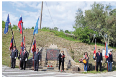
Utrinek komemoracije padlim za svobodo v Trseku