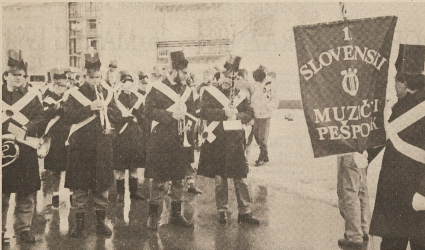
I. Slovenski muzični pešpolk — drugače ribniška pleh banda — v svečani opravi čaka na prihod karnevala