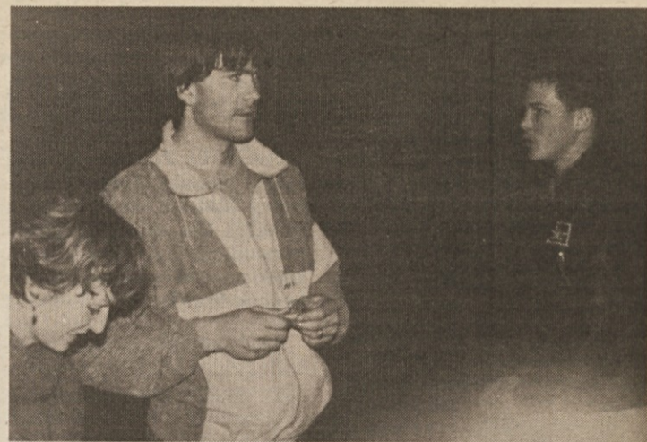
Takšnega zanimanja za obisk znane slovenske osebe v Ribnici dolgo ni bilo, kot za promocijo knjige in filma najboljšega svetovnega alpinista Toma Česna. Dvorana ribniškega doma JLA je bila polna, kljub relativno visokim cenam vstopnic in knjig. Obiskovalci so uživali v gledanju filma ter pripovedovanju samega Toma ob njegovem vzponu na največjo goro sveta LOTSZE.