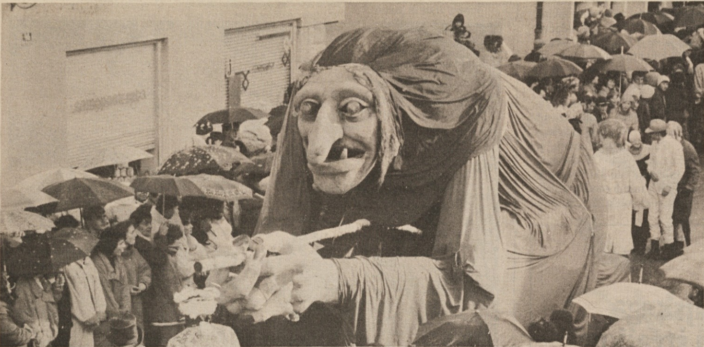
Čarovnica je iz Slivnice letos priletela na drugo stran, kakor prejšnje čase