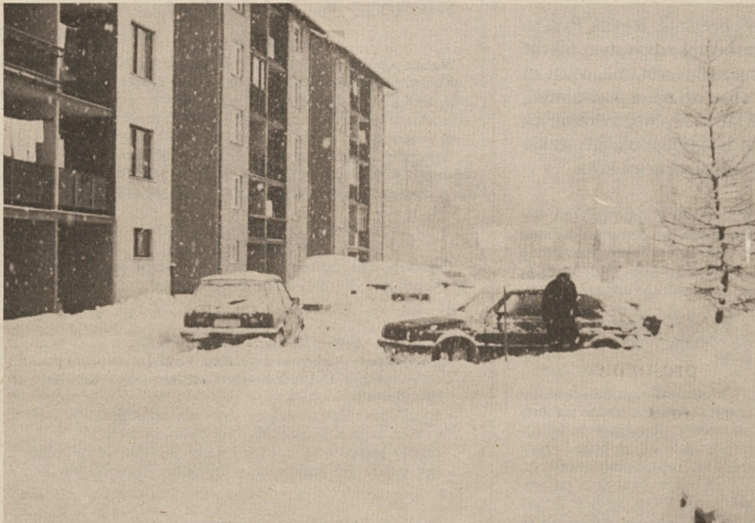
Tistega snežnega dne v februarju se komunalci niso prikazali na TVV vsaj do 13. ure, ko je nastala ta fotografija. Tako tu kot marsikje drugje po Ribnici in Sloveniji si z lopatami ni bilo moč kaj prida pomagati. Triletni počitek je »vrgel iz forme« tako komunalce kot voznike.

SODRAŽICA — V zadnjih letih so Sodražani s skupnimi