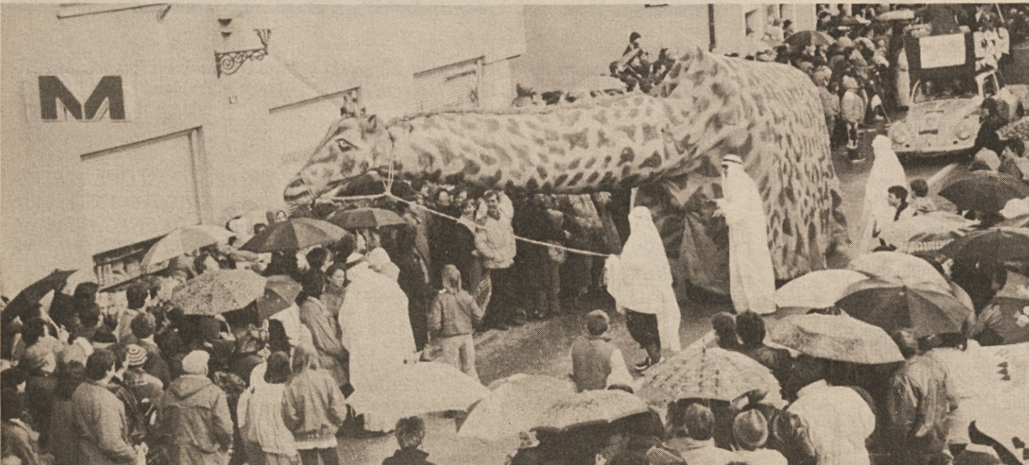
Goričevski hit karnevala: hidravlična žirafa, ki so ji zadišale dobrote iz Samopostrežbe