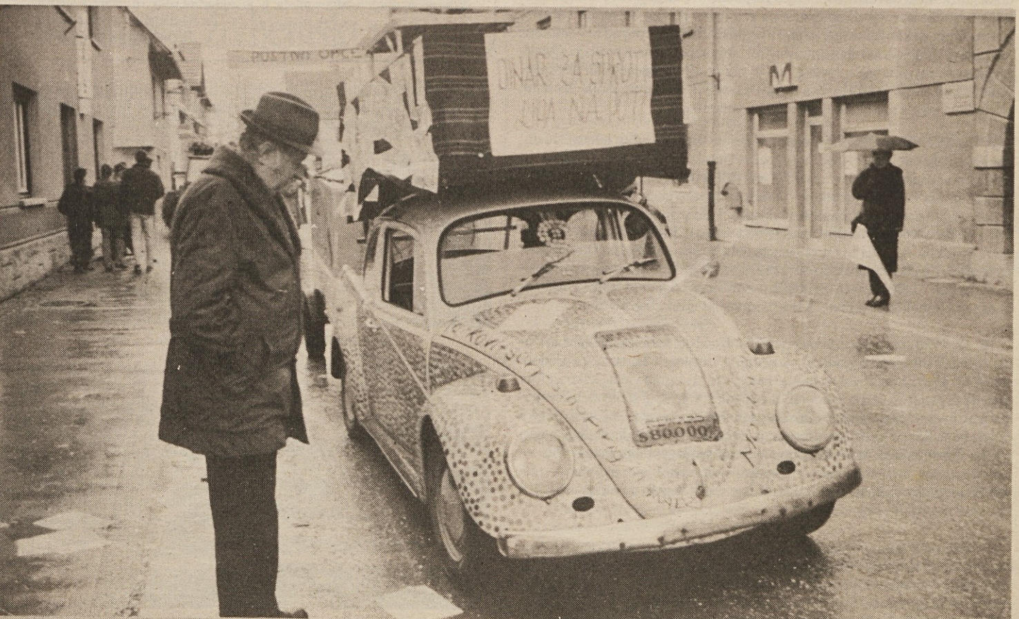
Strelna, tole pa so čisto pravi kovanci in bankovci!