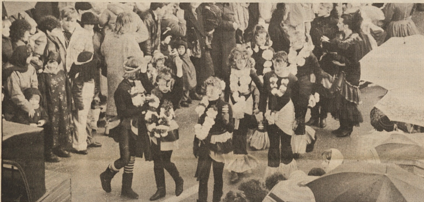
V ritmu sambe so zaplesale gostje iz Ria de Janeira...