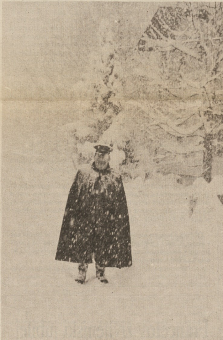
Vsem poštarjem, ki vsak mesec vestno raznesejo Rešeto na 4000 naslovov tudi v nemogočih vremenskih razmerah, se iskreno zahvalujemo. SO Ribnica in uredništvo REŠETA