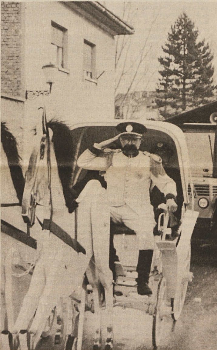
Z obiskom nas je počastil sam presvetli habsburški cesar Franc Jožef z belimi lipincanci...