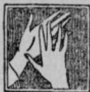
Lux je za roke popolnoma neškodljiv.

Zato perite brez skrbi vaše svileni perilo v Lux-u, zakaj to sredstvo, ki je brez primerne, vam je porok za največji aspeh ob največji udobnosti.